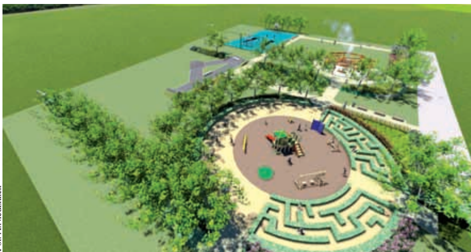
Tak ma wyglądać teren przy ulicy Jachtowej w dzielnicy Cetniewo

wości i mieszkańcy każdej z nich mają swoje oczekiwania i postulaty. Nie wszystkie możemy zrealizować od razu zwłaszcza, że nasz budżet jest ograniczony. Uważam, że w tym roku spotkania przebiegły w bardzo spokojnej atmosferze.