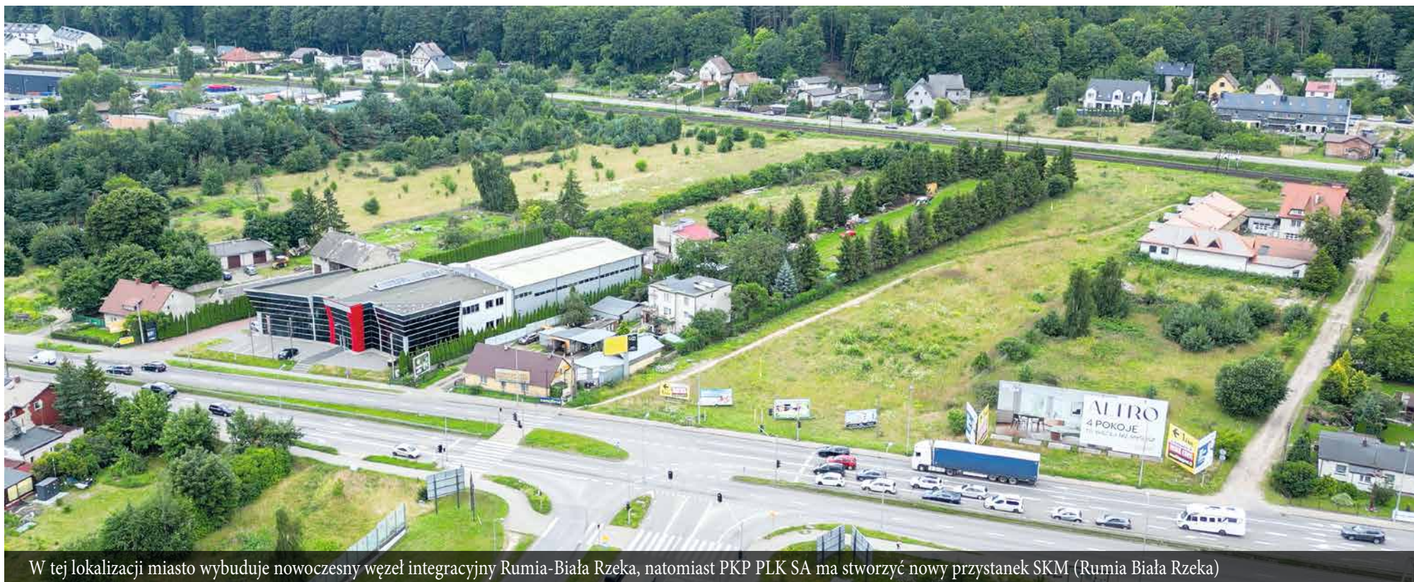
W tej lokalizacji miasto wybuduje nowoczesny węzeł integracyjny Rumia-Biała Rzeka, natomiast PKP PLK SA ma stworzyć nowy przystanek SKM (Rumia Biała Rzeka)