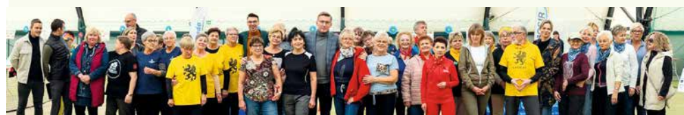
fol. UM Reda

SPORT | 1 października, który jest Międzynarodowym Dniem Seniorów, w Redzie odbyła się kolejna edycja Spartakiady Seniora, podczas której nie brakowało emocji, rywalizacji i doskonałej zabawy.