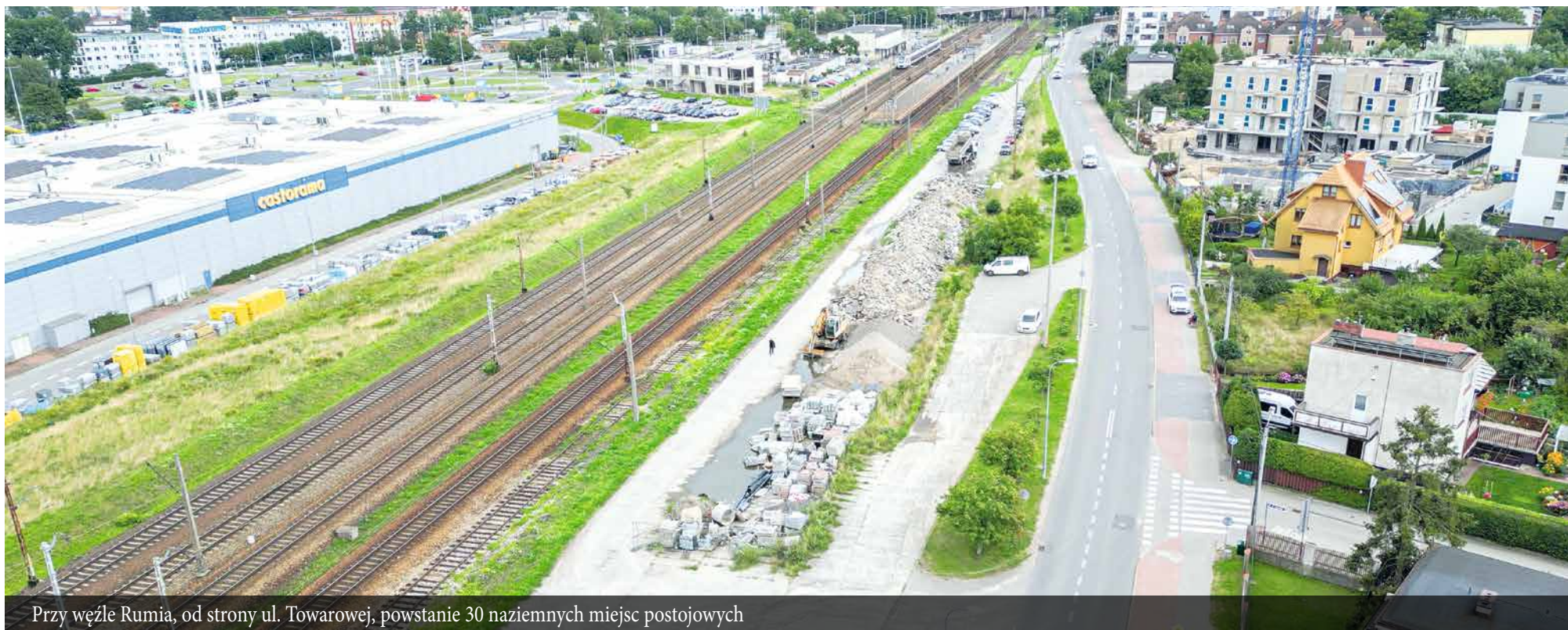
Przy węźle Rumia, od strony ul. Towarowej, powstaną 30 naziemnych miejsc postojowych

Zmiany zajdą także w centrum miasta, a dokładniej przy dworcu głównym (węzeł Rumia). W pobliżu ul. Starowiejskiej powstanie piętrowy parking na co najmniej 120 pojazdów, o powierzchni 3600 m 2 i wysokości około 18 m, z systemem monitorowania zajętości miejsc. Z kolei przy ul. Towarowej pojawi się 30 naziemnych miejsc postojowych. Natomiast PKP PLK S.A. wyremontuje i zmodernizuje pobliski dworzec oraz perony, gdzie powstaną m.in. windy.