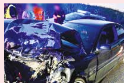
fol. KPP Wejherowo