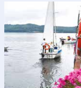
fot. Centrum Kultury i Biblioteka w Gniewinie