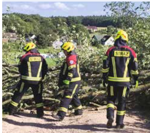
Grant przyznany przez Polskie Sieci Elektroenergetyczne S.A pozwoli na realizację projektu wyposażenia jednostki w niezbędny sprzęt ochrony strażaka-ratownika OSP.

GMINA CHOCZEWO | Ochotnicza Straż Pożarna w Słajszewie została laureatem 7. edycji programu Wzmocnij Swoje Otoczenie .