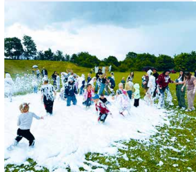
fol. OSP Milwino

GMINA LUZINO | Na boisku sołeckim w Milwinie odbędzie się wielki piknik rodzinny dla mieszkańców całej gminy pn. „Sołectwa Razem”.