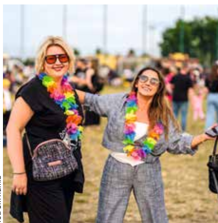
fol. UM Rumia