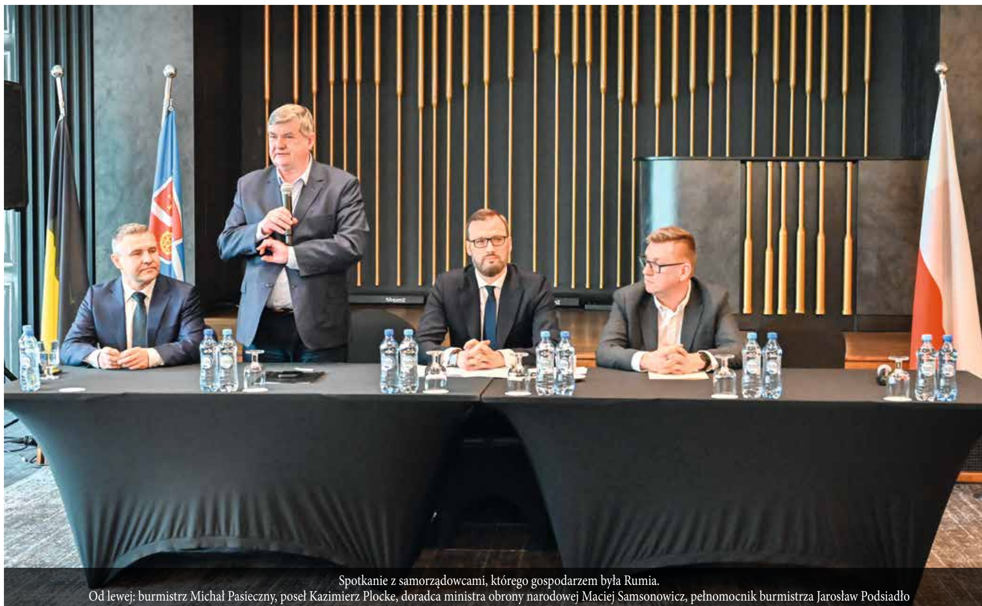
Spotkanie z samorządowcami, którego gospodarzem była Rumia.