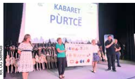
fol. UG Szemud