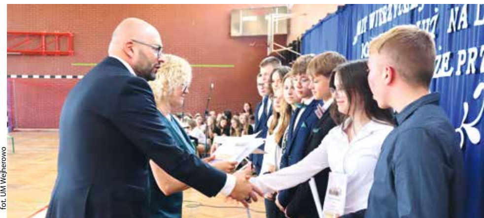
fol. UM Wejherowo

WEJHEROWO | 427. absolwentów wejherowskich szkół podstawowych odebrało świadectwa, a najlepsi uczniowie – gratulacje. Pożegnanie absolwentów było pełne wzruszeń, podsumowań i wspomnień. Zastępca prezydenta Wejherowa Arkadiusz Kraszkiewicz, gratulował uczniom, ich rodzicom i nauczycielom osiągniętych sukcesów.