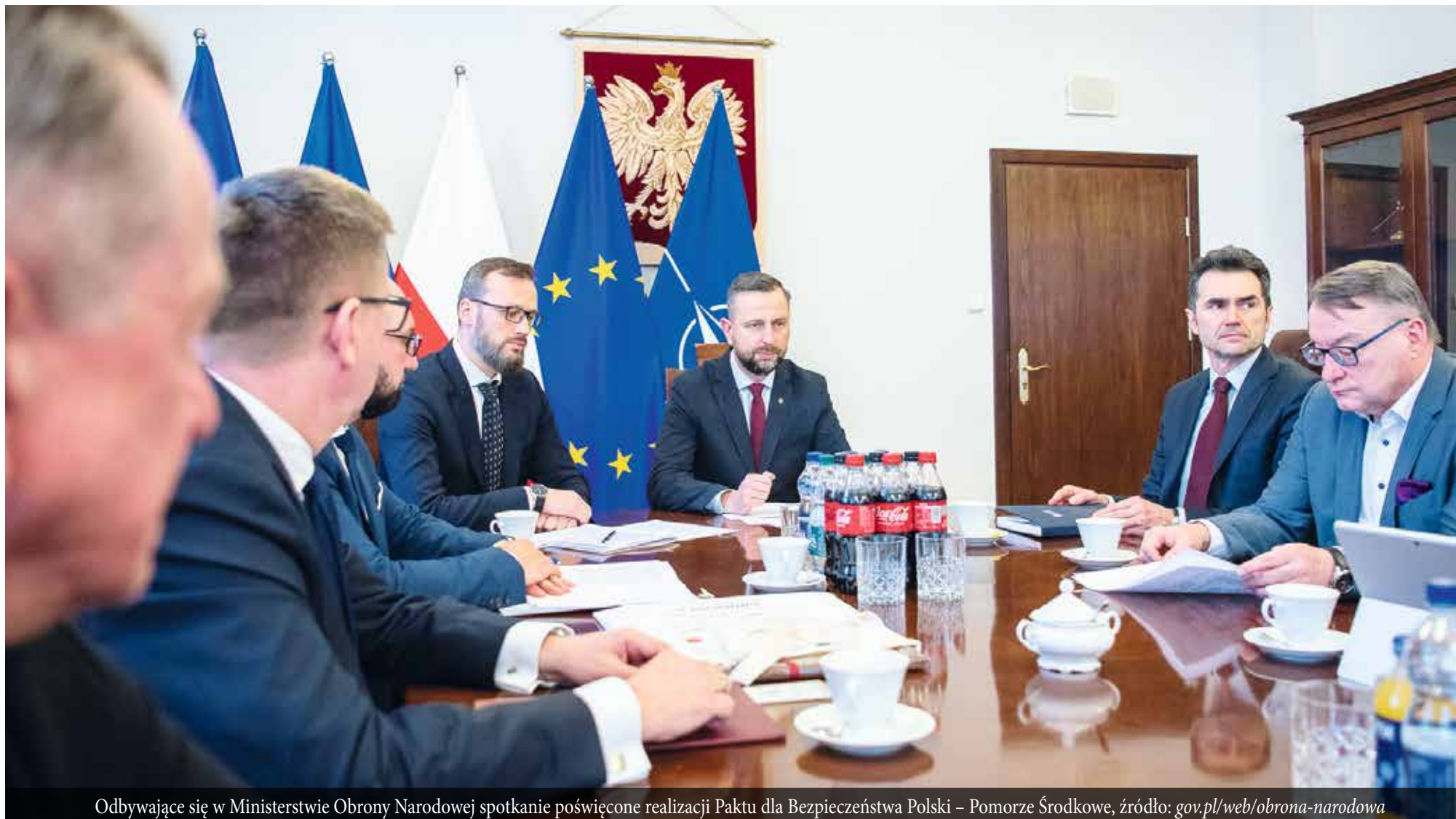
Odbywające się w Ministerstwie Obrony Narodowej spotkanie poświęcone realizacji Paktu dla Bezpieczeństwa Polski – Pomorze Środkowe, źródło: gov.pl/web/obrona-narodowa

POWIAT | Dwie ważne dla Pomorza drogi są coraz bliżej realizacji. Budowa Drogi Czerwonej i trasy Via Pomerania – kluczowych dla bezpieczeństwa państwa oraz wyczekiwanych przez lokalnych kierowców – nabiera realnych kształtów. Co to oznacza dla regionu?