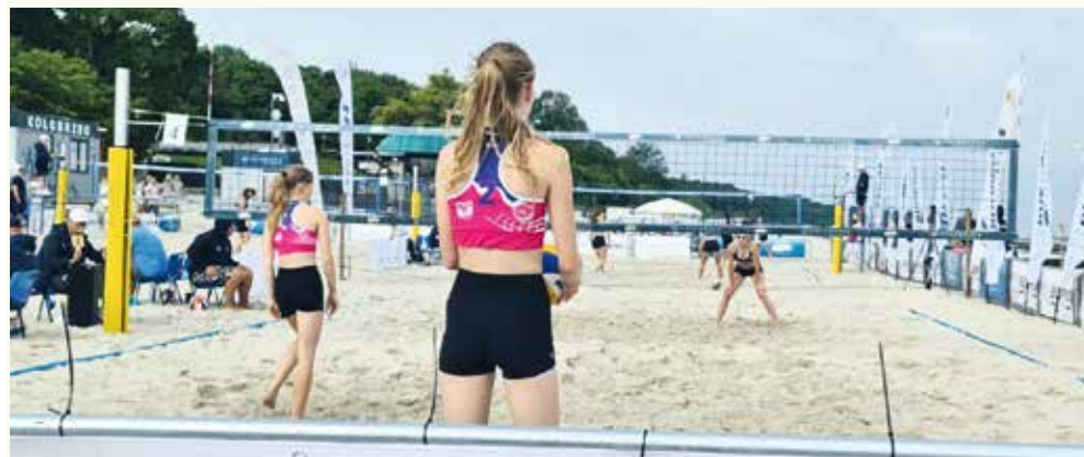
fol. UKS Jedynka Reda - Drużyny Młodzieżowe

SIATKÓWKA PLAŻOWA | Dwa intensywne dni rywalizacji, 15 rozegranych setów i sportowy charakter wystawiony na próbę – tak wyglądała droga młodziczek UKS Jedynka Reda do finału Mistrzostw Polski w siatkówce plażowej.