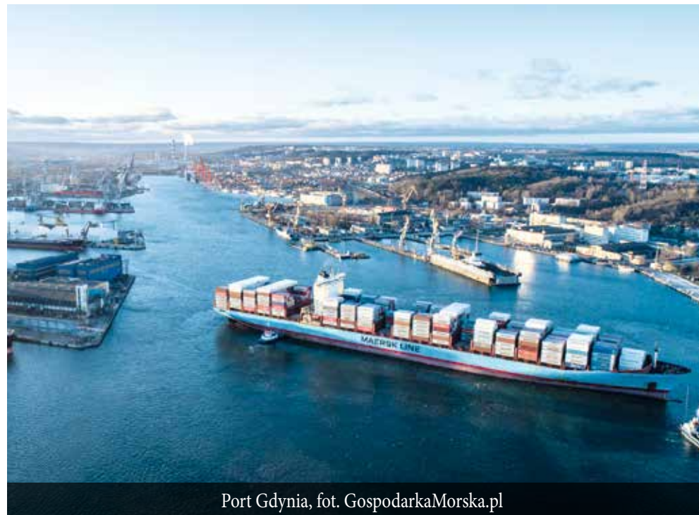
Port Gdynia

Według wstępnych założeń Droga Czerwona będzie miała około 9 km długości, dwie jezdnie i status drogi szybkiego ruchu. Zostanie połączona z pięcioma innymi ważnymi trasami za pomocą węzłów drogowych. Projekt nie przewiduje ograniczeń wagowych pojazdów, co umożliwi przejazd ciężkiego transportu do i z portu w Gdyni. W ten sposób zmniejszy się ruch na często przeciążonej Estakadzie Kwiatkowskiego.