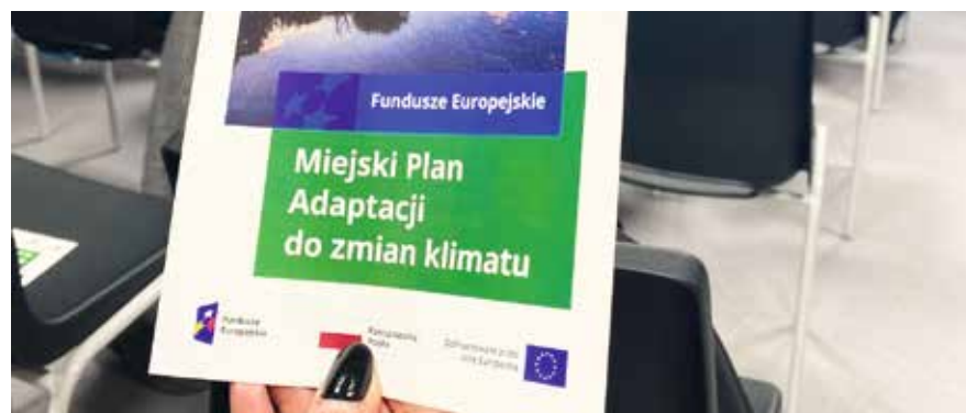
„Opracowanie Miejskiego Planu Adaptacji do zmian klimatu dla Gminy Miasto Reda” jest dofinansowany z programu Fundusze Europejskie na Infrastrukturę, Klimat, Środowisko 2021-2027, działanie FENX.02.04 Adaptacja do zmian klimatu, zapobieganie klęskom i katastrofom. Wartość projektu: 263 166,50 PLN. Wysokość dofinansowania: 209 770,01 PLN.