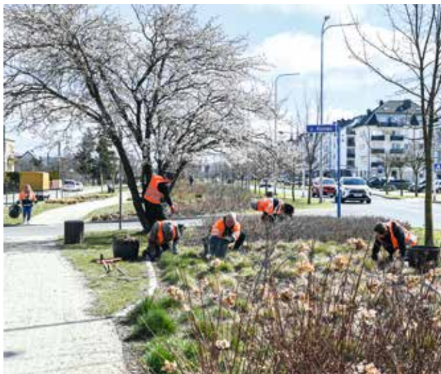
fol. UM Rumia

Wiosenne porządki to także okres szczególnej pielęgnacji miejskiej zieleni. Prace polegają między innymi na usunięciu uszkodzonych podczas zimy roślin. Aktualnie realizowana jest przycinka krzewów, bylin i traw, natomiast w maju zostanie uzupełniona warstwa kory ozdobnej.