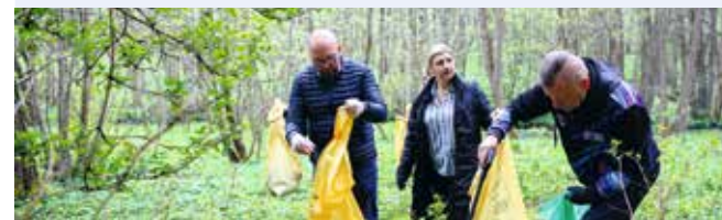
fol. UM Wejherowo

WEJHEROWO | W ramach obchodów Międzynarodowego Dnia Ziemi, pracownicy Urzędu Miejskiego w Wejherowie oraz przedstawiciele lokalnych jednostek samorządowych wzięli udział w wspólnej akcji sprzątania miejskich lasów.