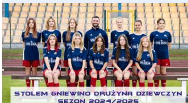
STOLEM GNIEWINO DRUŻYNA DZIEWCZYN SEZON 2024/2025

GMINA GNIEWINO | W Stolemie Gniewino powstała pierwsza drużyna kobiet w historii klubu.