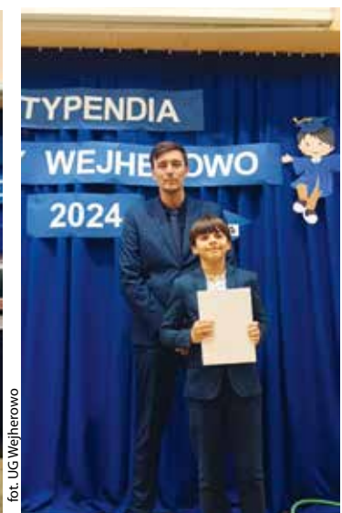
fot. UG Wejherowo