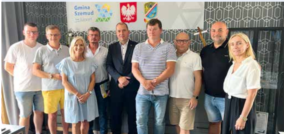
fol. UG Szemud

GMINA SZEMUD | W Centrum Samorządowym w Szemudzie przyjmowano grupę samorządowców z największej w Polsce Lokalnej Grupy Działania „BUD-UJ RAZEM”.