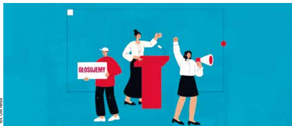
fol. UM Reda

Miejska Komisja Wyborcza zweryfikuje następnie poprawność procedury głosowania do dnia 28 października 2024 r. i sporządzi protokół, który dostępny będzie na stronie BIP Urzędu Miasta w Redzie.