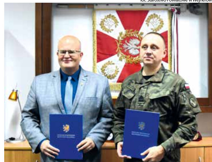
fol. Starostwo Powiatowe w Wejherowie

Celem zawartego porozumienia jest m.in. zwiększenie świadomości młodego pokolenia i lokalnej społeczności na temat roli i znaczenia sił zbrojnych w historii Polski oraz zachęcenie młodzieży do wstępowania w szeregi wojska. Porozumienie zostało zawarte na okres 5 lat.