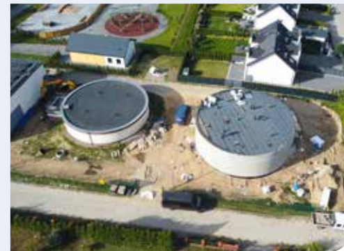
fol. UG Szemud

nieplanowane wyłączenia prądu. Dzięki agregatom będziemy w stanie utrzymać nieprzerwanie pracę Stacji Uzdatniania Wody w sytuacjach kryzysowych – zapowiada Urząd Gminy Szemud.