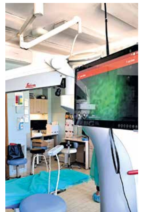
fol. Szpitala Pomorskie FB