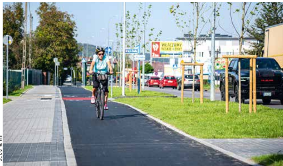
fol. UM Rumia