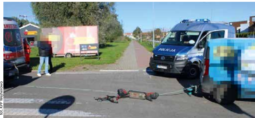
fol. KPP Wejherowo

RUMIA | We wtorek doszło do wypadku z udziałem dwóch aut i kierowcy hulajnowy elektrycznej. Ze wstępnych ustaleń policjantów wynikało, że mężczyzna kierujący hulajnogą wjechał w nieprawidłowo oznakowaną linię holowniczą między dwoma samochodami.