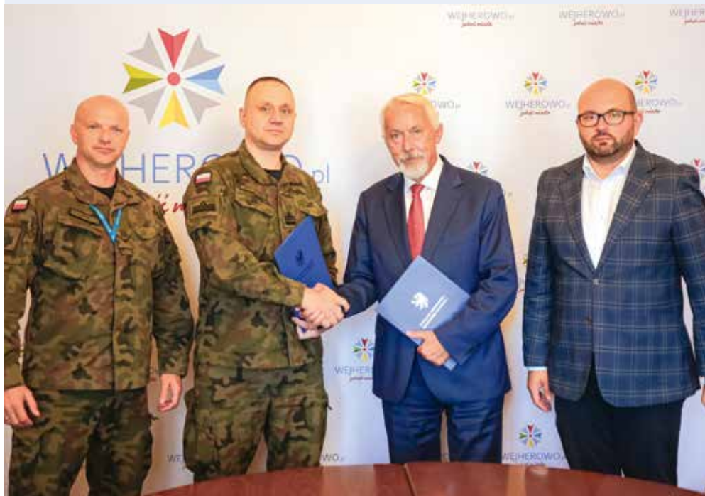
fol. UM Wejherowo

WEJHEROWO | W wejherowskim Ratuszu zostało podpisane Porozumienie o współpracy między Batalionem Dowodzenia Marynarki Wojennej im. płk. Kazimierza Pruszkowskiego a Gminą Miasta Wejherowa.