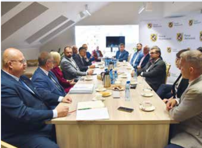
fol. Starostwo Powiatowe w Wejherowie

POWIAT | W Starostwie Powiatowym w Wejherowie, z inicjatywy Starosty Wejherowskiego Marcina Kaczmarka, odbyło się spotkanie Powiatowej Rady Przedsiębiorczości.