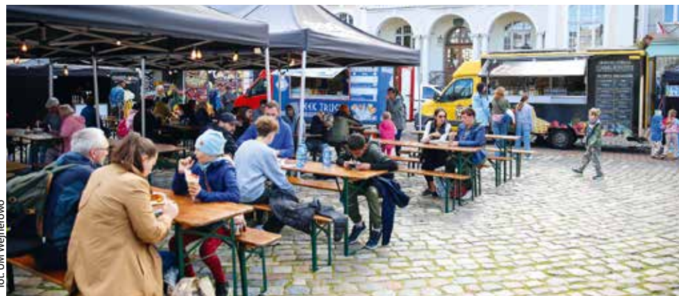
fol. UM Wejherowo