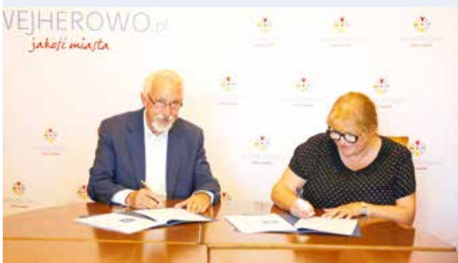
fol. UM Wejherowo

WEJHEROWO | Kolejna kamienica w centrum miasta otrzymała dofinansowanie na remont i prace konserwatorsko-restauracyjne.