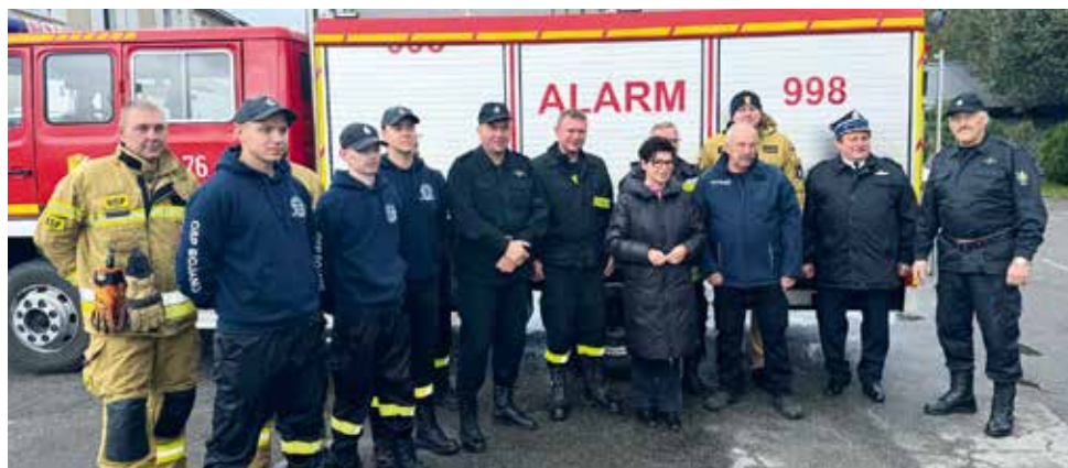
fol. UG Szemud

Gmina Bystrzyca Kłodzka ma 32 sołectwa, a na jej terenie funkcjonuje 10 jednostek OSP. Przekazany wóz będzie jednym z najlepszych pojazdów w tych jednostkach. Dlatego ta pomoc jest tak bardzo ważna dla nich w tej chwili.