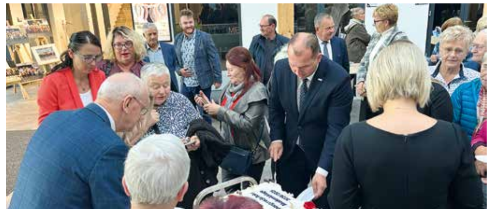
fol. UG Szemud