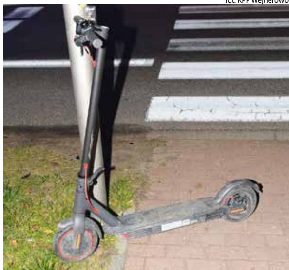
fot. KPP Wejherowo