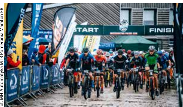
fol. MH Automatyka MTB Pomerania Maraton FB