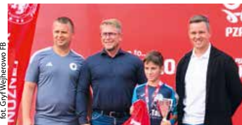
fol. Gryf Wejherowo FB

PIŁKA NOŻNA | Ostatni okres jest niezwykle udany dla juniorów Gryfa Wejherowo. Poszczególni zawodnicy mogą pochwalić się indywidualnymi osiągnięciami.