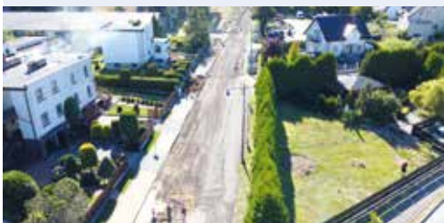
fol. UG Szemud

Za utrudnienia gmina przeprosza i prosi kierowców o cierpliwość. Jest to pierwszy etap przebudowy trasy Kielno - Kowalewo na odcinku 5,5 km.