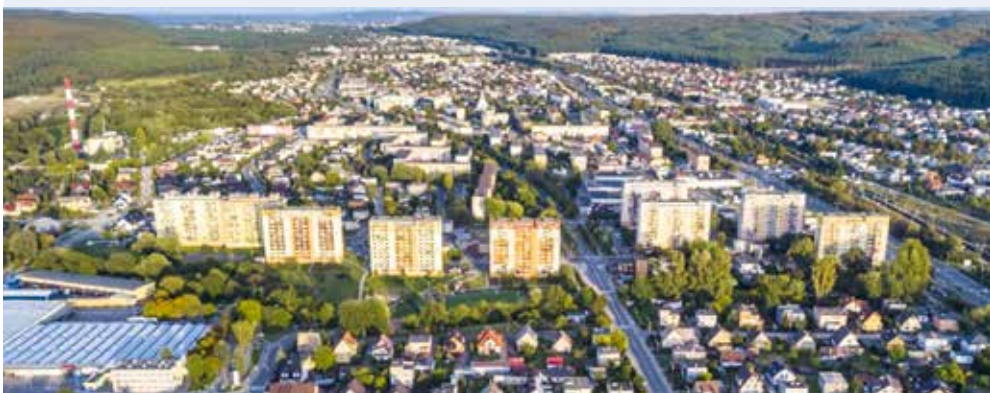
fol. UM Wejherowo

WEJHEROWO | 17 listopada 2024 r. odbędą się w Wejherowie wybory do rad wejherowskich osiedli. Wybory do rad zostaną przeprowadzone w czterech okręgach wyborczych: Osiedle „Przemysłowa”, Osiedle „Sucharskiego”, Osiedle „Śmiechowo - Północ I”, Osiedle „Śmiechowo Południe”.