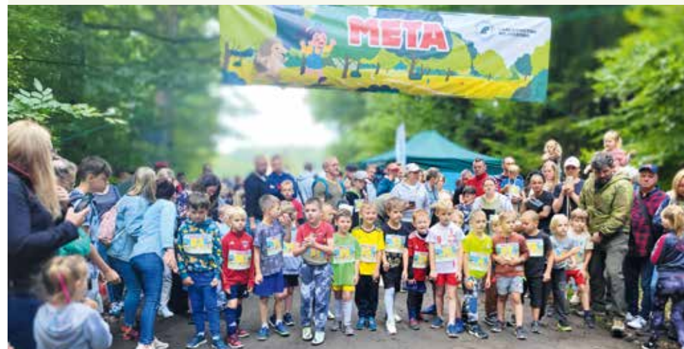
fol. Nadleśnictwo Wejherowo

Zamysłem corocznej akcji jest pomoc i zebranie środków na szczytny cel oraz propagowanie aktywnego stylu życia.