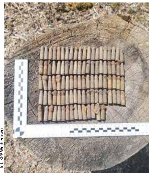
fol. KPP Wejherowo

POWIAT | Policjanci z Komisariatu Policji w Gniewinie otrzymali zgłoszenie o nietypowym odkryciu w miejscowości Łętówko. Mieszkaniec gminy, który przeczesywał teren z wykrywaczem metalu, natknął się na niebezpieczne znalezisko.