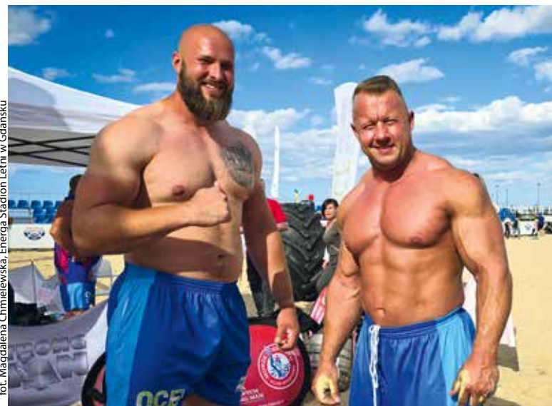
Energia Stadion Letni w Gdańsku