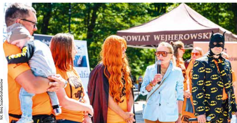
fol. Bieg Superbohaterów