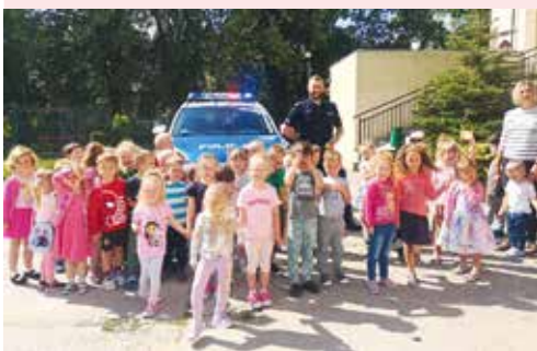
fol. KPP Wejherowo

POWIAT | Dzielnicowy z Komisariatu Policji w Gniewinie na terenie Choczewa przeprowadził spotkania z dziećmi. Tematem spotkań było bezpieczeństwo na drodze. Nie brakowało kwestii wakacji.