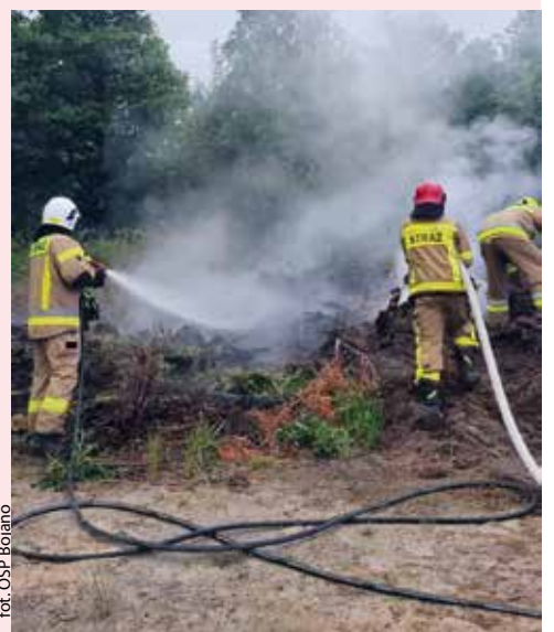
fol. OSP Bojano