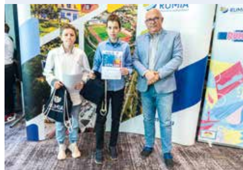
zwycięzcy klas VI - VII

RUMIA | Przez wiele trudnych i skomplikowanych pytań musieli przejść uczniowie rumskich szkół by udowodnić, że to co ściśle jest związane z Unią Europejską nie jest dla nich skomplikowane. Była to już czwarta edycja Turnieju Wiedzy o UE.