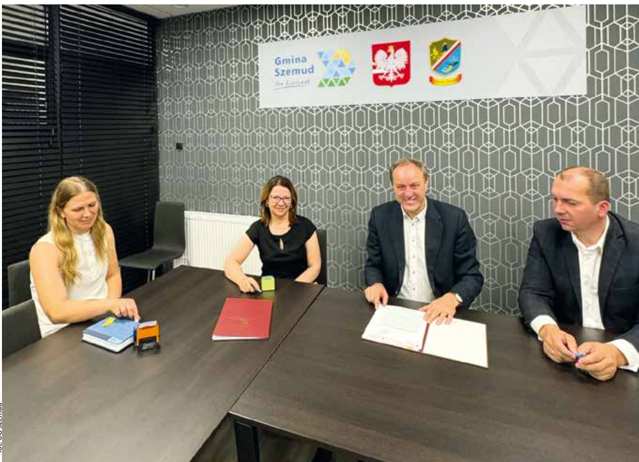
fort. UG Szemud

GMINA SZEMUD | Gmina będzie realizować dodatkowe zajęcia w szkołach za ponad 2 mln zł w Szemudzie.