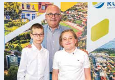
zwycięzcy klas IV - V

Tradycyjnie młodzież musiała wykaazać się wszechstronną wiedzą na temat struktur unijnych, państw członkowskich, istotnych dla wspólnoty wydarzeń i dat, charakterystycznych obiektów architektonicznych, a nawet gospodarki, zwyczajów czy znanych postaci. Zadania miały formę pytań otwartych i zamkniętych