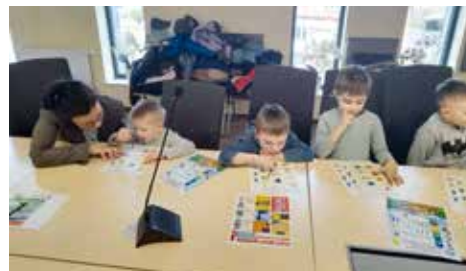
fol. UM Reda

REDA | W Urzędzie Miasta Reda przedszkolaki z „Milo” Akademii Małego Człowieka w Redzie uczestniczyły w ciekawej lekcji o tematyce ekologicznej.