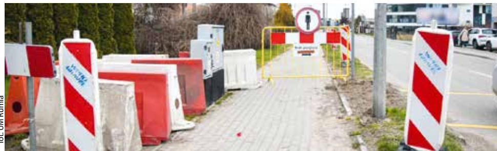
fol. UM Rumia

RUMIA | Przez liczne prace drogowe w różnych częściach miasta występują utrudnienia. Podpowiadamy, gdzie trzeba uważać.