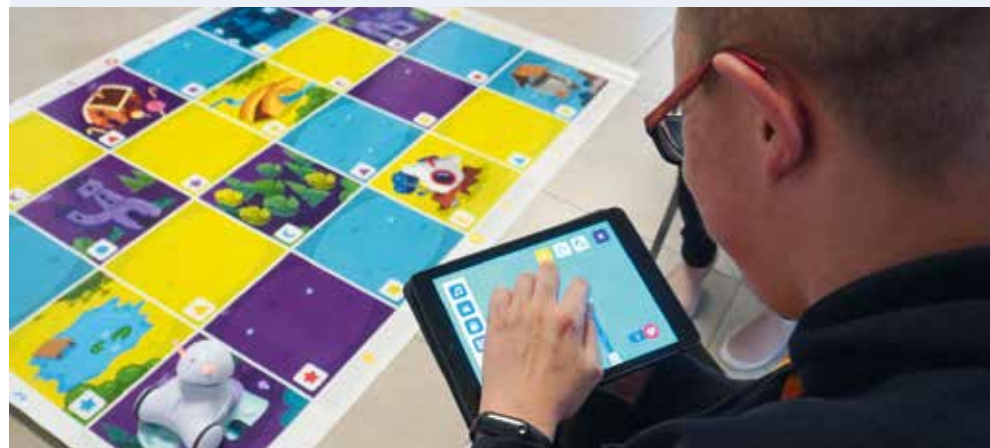
fol. Biblioteka Publiczna Gminy Linia

GMINA LINIA | W Dziennym Domu Pobytu w Linii odbywały się zajęcia z programowania dla mieszkańców, których odwiedzili roboty.