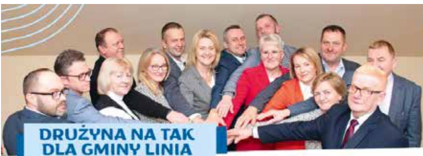
DRUŻYNA NA TAK DLA GMINY LINIA