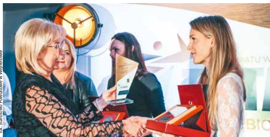
fol. Starostwo Powiatowe w Wejherowie

POWIAT | Otrzymała się pierwsza edycja powiatowego konkursu „Tytani Przedsiębiorczości Powiatu Wejherowskiego” za rok 2023. Celem wydarzenia jest przede wszystkim szeroko rozumiana promocja gospodarcza przedsiębiorstw działających na terenie powiatu oraz kształtowanie pozytywnego wizerunku regionu jako dogodnego obszaru do prowadzenia i rozwijania działalności gospodarczej.