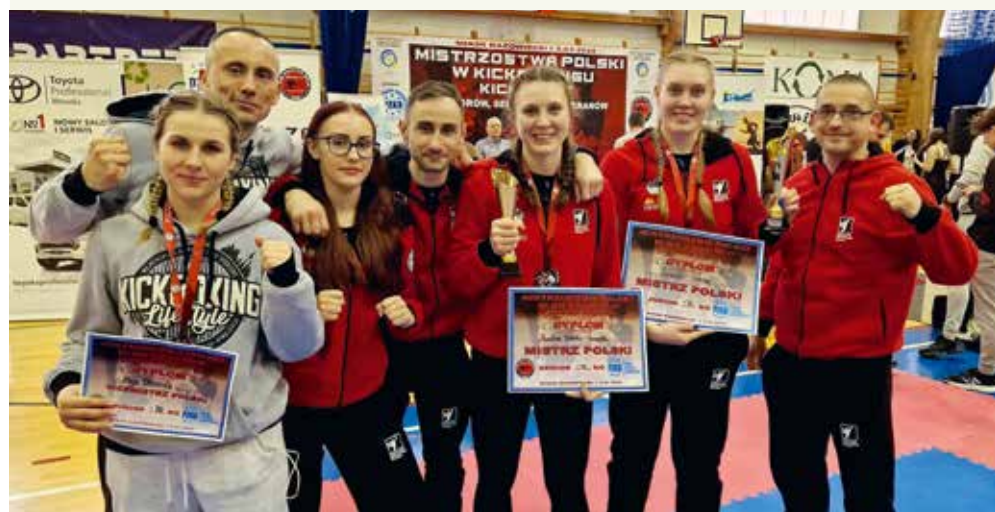
fol. GOSRIT Luzino

KICKBOXING | W Mińsku Mazowieckim odbyły się Mistrzostwa Polski w kickboxingu juniorów, seniorów i weteranów w formule kick-light. Zawody odbywały się pod patronatem Polskiego Związku Kickboxingu.