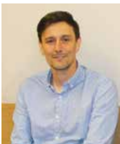
Wójt Gminy Wejherowo Przemysław Kiedrowski