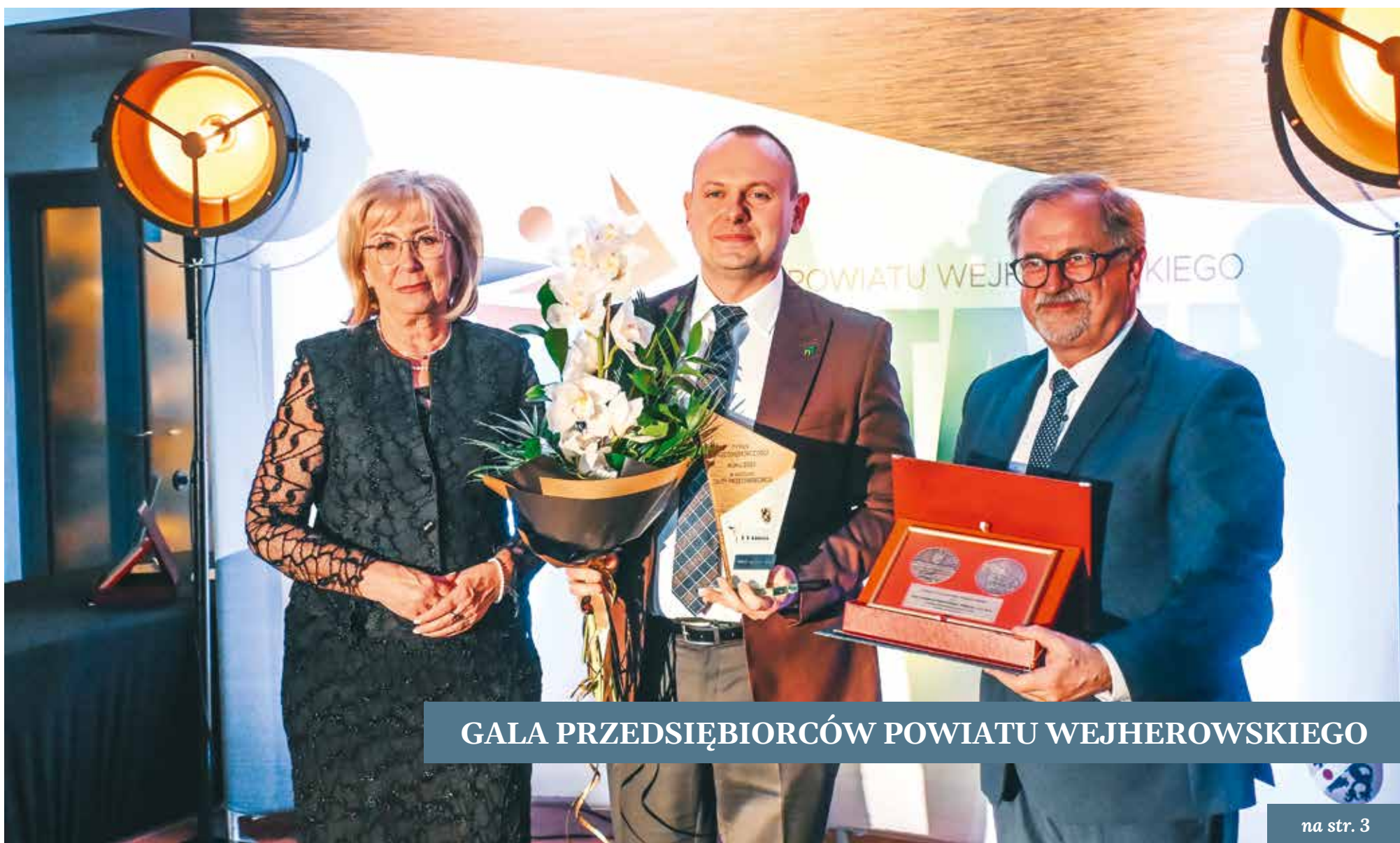
GALA PRZEDSIĘBIORCÓW POWIATU WEJHEROWSKIEGO