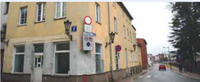
fol. UM Wejherowo

WEJHEROWO | Wejherowscy radni podczas ostatniej sesji przyznali 137 tys. zł na remonty zabytkowych budynków mieszkalnych. Miasto Wejherowo od wielu lat konsekwentnie finansowo wspiera renowację zabytkowych obiektów.