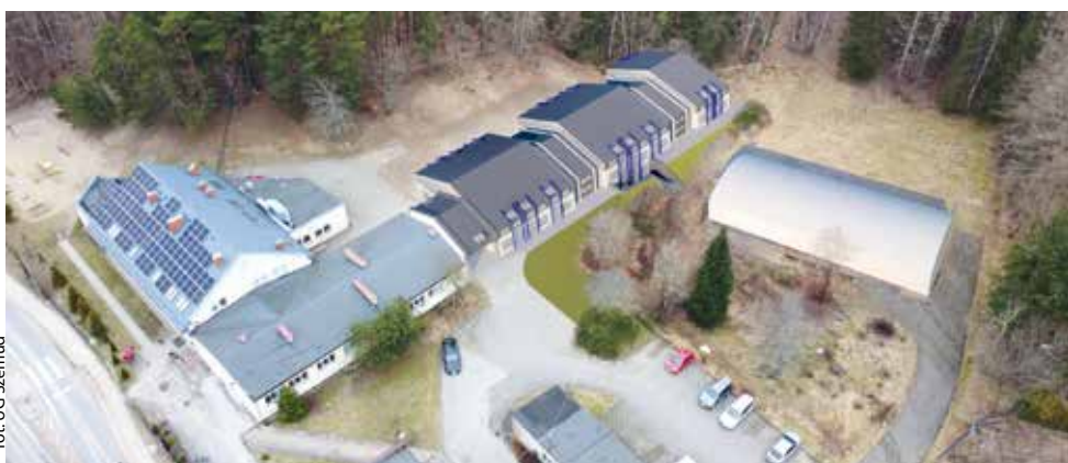
fol. UG Szemud

GMINA SZEMUD | Z dumą gmina zaprezentowała wizualizację rozbudowy szkoły w Koleczkowie. To kolejny sukces i etap tego przedsięwzięcia.