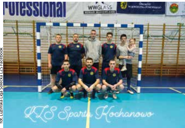
for. Luzińska Liga Sołecka LZS Facebook

FUTSAL | Za nami czwarta kolejka spotkań Luzińskiej Ligi Sołeckiej. Nastąpiły rozszady w tabeli.