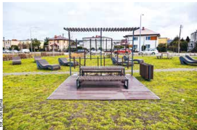
for. UM Rumia

RUMIA | „Zielone wyspy” znajdujące się w Rumi zostały odnowione.