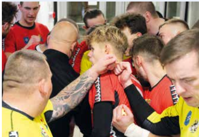
for. Tytani Wejherowo Facebook

PIŁKA RĘCZNA | Szczypiorniści Tytanów Wejherowo kontynuują passę zwycięstw, tym razem wracając z wygraną, z Bydgoszczy.