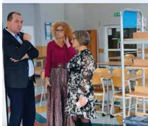
fol. UG Szemud

GMINA SZEMUD | Gminne obiekty są modernizowane i dostosowywane do potrzeb mieszkańców. Związane jest to również z przeznaczeniem środków na podnoszenie bezpieczeństwa w placówkach edukacyjnych.