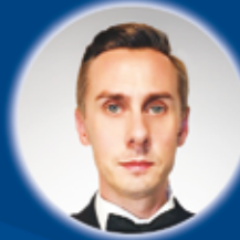
JACEK WRÓBEL baryton