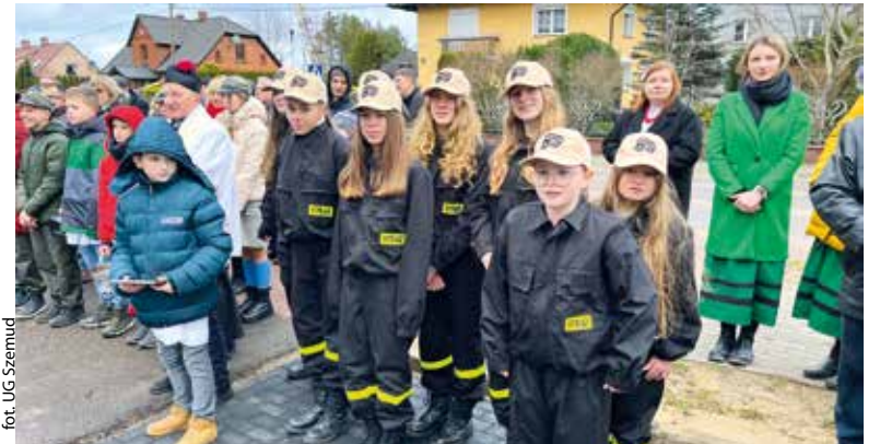
for. UG Szemud