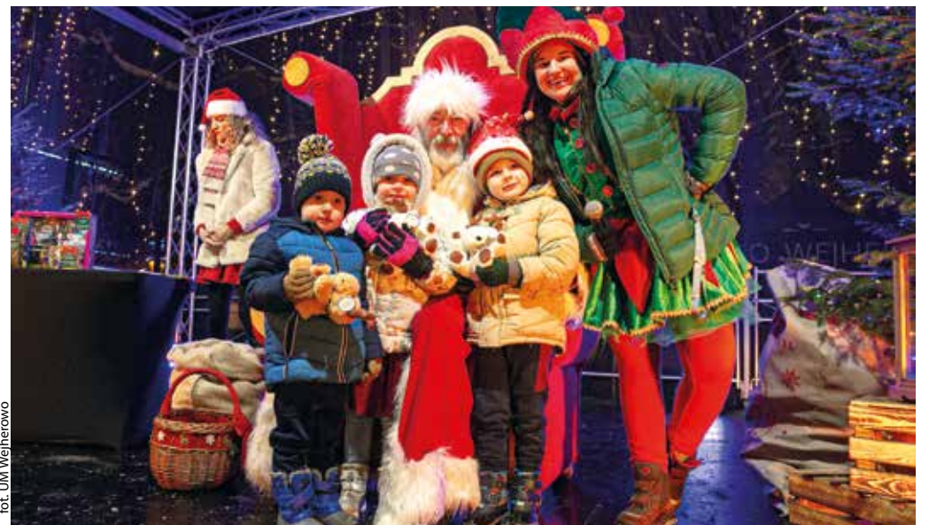
for. UM Wejherowo