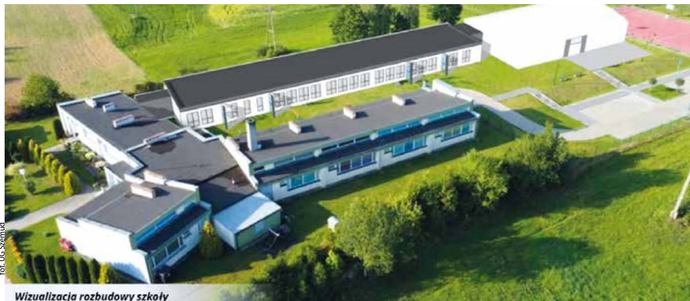
Wizualizacja rozbudowy szkoły

Gmina przypomina, że na tę samą szkołę w Łebieńskiej Hucie zdobyto 2,25 mln zł z programu Olimpia od Ministerstwa Sportu i Turystyki. Na sześć hal przy szkołach pozyskana kwota to blisko 13 mln zł. Gmina będzie informować na bieżąco o postępie prac przy tym projekcie.