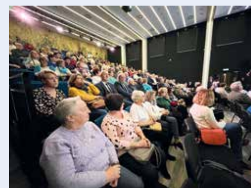
fol. UG Szemud

Gmina serdecznie zaprasza do bibliotek: w Szemudzie, w Kielnie, w Bojanie oraz w Łebnie, gdzie są dostępne deklaracje członkostwa Uniwersytetu Trzeciego Wieku Gminy Szemud oraz listy zapisów na planowane zajęcia. Pierwszy wykład odbędzie się