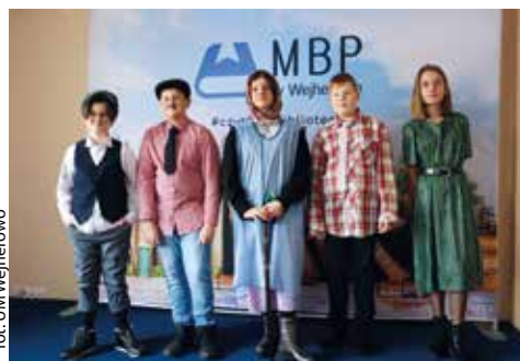
fol. UM Wejherowo