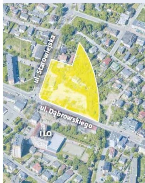
fol. UM Rumia

RUMIA | Trwa przygotowanie terenu pod realizację inwestycji. Do połowy listopada zakończy się rozbiórka budynku przy ul. Starowiejskiej 12, kolejne wyburzenia planowane są na początek przyszłego roku.