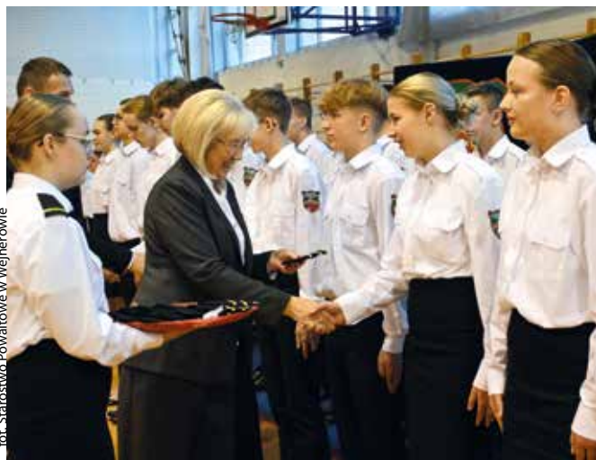
for. Starostwo Powiatowe w Wejherowie

POWIAT | W Powiatowym Zespole Szkół w Redzie oraz w Powiatowym Zespole Szkół nr 3 w Wejherowie odbyło się uroczyste ślubowanie uczniów klas mundurowych. W ten sposób oficjalnie zostali wcieleni do społeczności szkolnej.