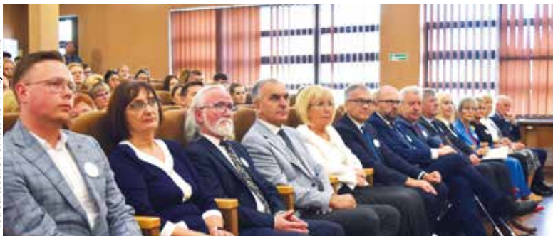
fol. Sartostwo Powiatowe w Wejherowie

wym i gospodarczym. Efektem tego współdziałania jest systematyczne wprowadzanie nowych kierunków kształcenia. Placówka oferuje studia licencjackie o profilu praktycznym, studia magisterskie oraz studia podyplomowe, m.in. na kierunkach socjologia, pielęgniarstwo czy zarządzanie.