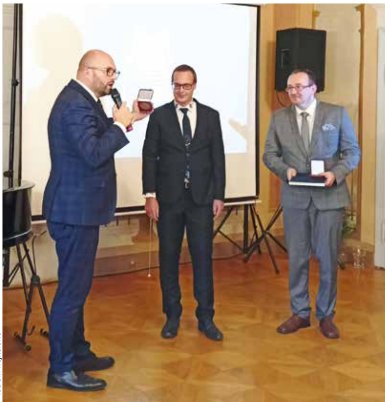
fol. UM Wejherowo