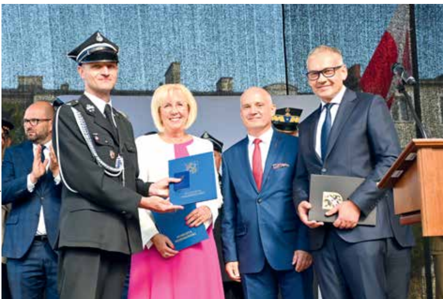
fol. Sartostwo Powiatowe w Wejherowie

Ochotnicza Straż Pożarna w Wejherowie obchodziła jubileusz 150-lecia istnienia. Wydarzenie było okazją do uhonorowania działalności jednostki Medalem „Za Zasługi dla Powiatu Wejherowskiego”, za aktywną, pełną zaangażowania działalność na rzecz społeczności lokalnej.