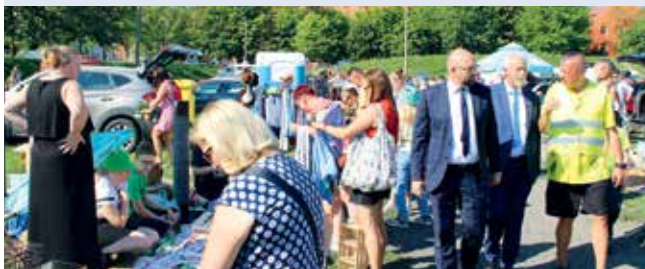
fol. UM Wejherowo

WEJHEROWO | Za nami już VII Pchli Targ w Wejherowie, który zgromadził wielu wystawców a także przyciągnął liczną rzeszę osób poszukujących taniej okazji, bądź kolekcjonerskiej perełki.