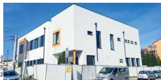
fol. UM Reda

REDA | Miejska Biblioteka Publiczna w Redzie nabiera blasku, a na budowie widać postępy prac.