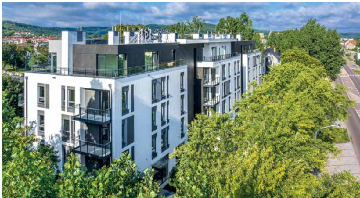
Inwestycja przy Dąbrowskiego to jeden z najciekawszych nowych budynków w Rumi

ul. Kielnieńska 57, Gdańsk Osowa tel. 607 607 216 tel. 607 607 464 www.pomorskiedomy.pl biuro@pomorskiedomy.pl