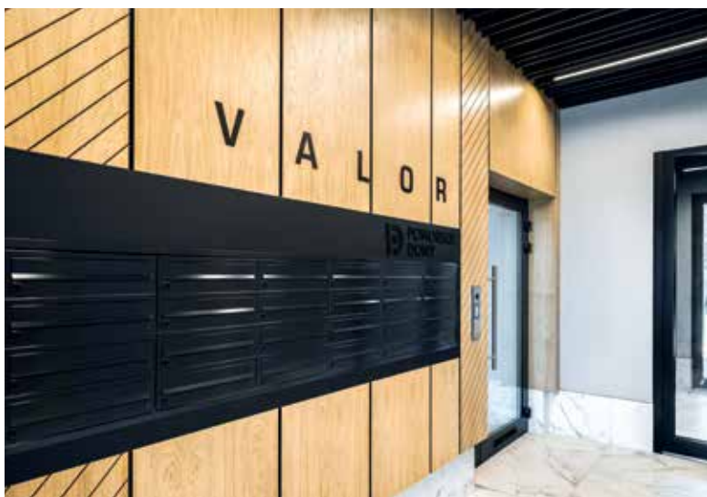
Klatki schodowe Valora wykonane zostaną z najlepszych materiałów budowlanych

No i doczekaliśmy się - piękna kamienica miejska Valor, którą gdański inwestor, firma Pomorskie Domy, przygotowywał przez ostatnie półtora roku przy Dąbrowskiego 44, jest już gotowa. Z tej okazji deweloper organizuje Dni Otwarte, na które zaprasza wszystkich mieszkańców Małego Trójmiasta. Imprezę zaplanowano na 23 września, a przygotowania do niej idą „pełną parą”.