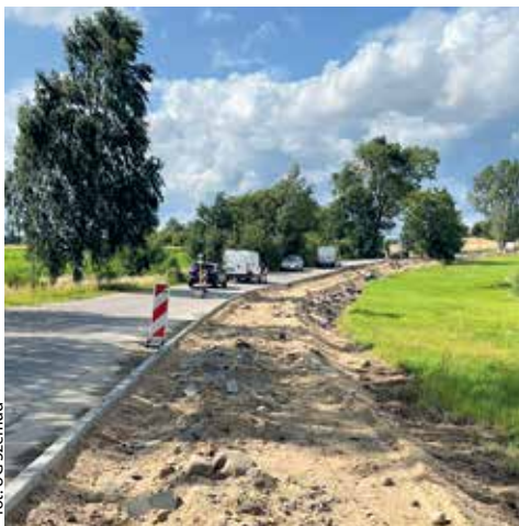
for. UG Szemud

GMINA SZEMUD | Gmina otrzymała kolejne dofinansowanie na modernizację ulicy Gryfa Pomorskiego w Warznie. Prace trwają już od strony Kielna, gdzie także u zbiegu ulic powstanie rondo.