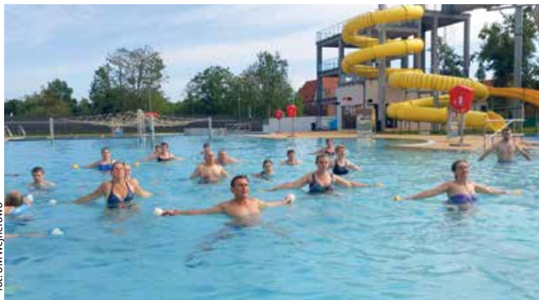
fol. UM Wejherowo