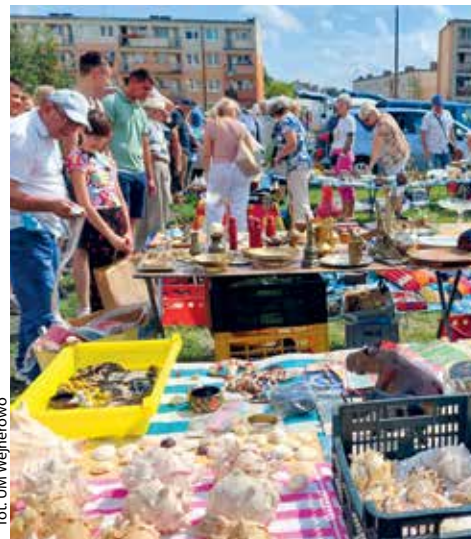
for. UM Wejherowo

WEJHEROWO | Książki, wśród których można było znaleźć „białe kruki”, unikatowa ceramika, meble, płyty i kasety magnetofonowe, odzież, ale także sprzęty AGD, sprzęt sportowy, fotograficzny, części motoryzacyjne – słowem wszystko, co tylko nadaje się do sprzedania, można było znaleźć podczas kolejnej edycji Pchlego Targu w Wejherowie.