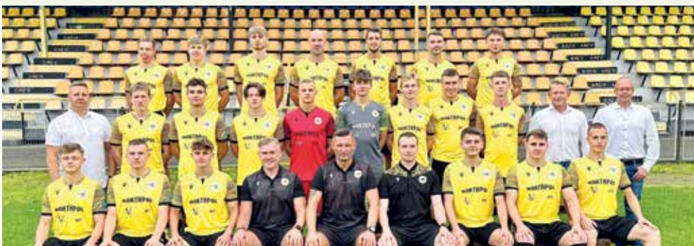
fol. WKS Gryf Wejherowo

PIŁKA NOŻNA | Rozlosowano pary pierwszej rundy Pucharu Polski. W rezultacie Gryf Wejherowo zmierzy się z Zagłębiem Sosnowiec.