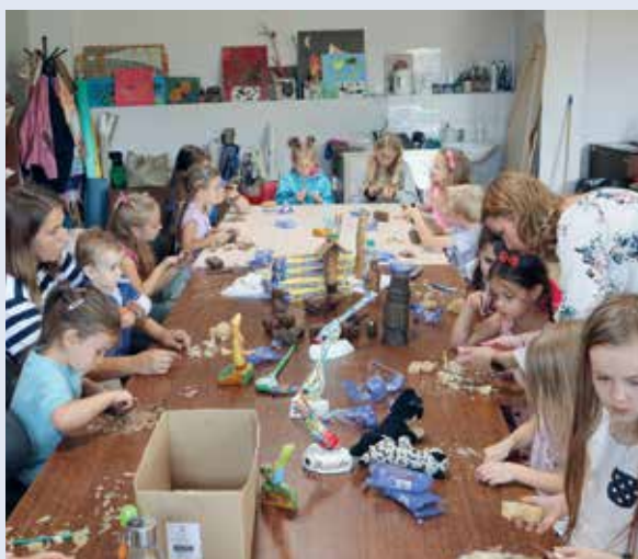
fol. UM Wejherowo