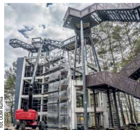
fol. UUM Rumia

RUMIA | Zostały już wykonane schody terenowe i podestowe, pomost widokowy, placiki rekreacyjne, amfiteatr, sieć elektroenergetyczna i teletechniczna, a także zamontowano urządzenia na placu zabaw i wzniesiono konstrukcję wieży widokowej.