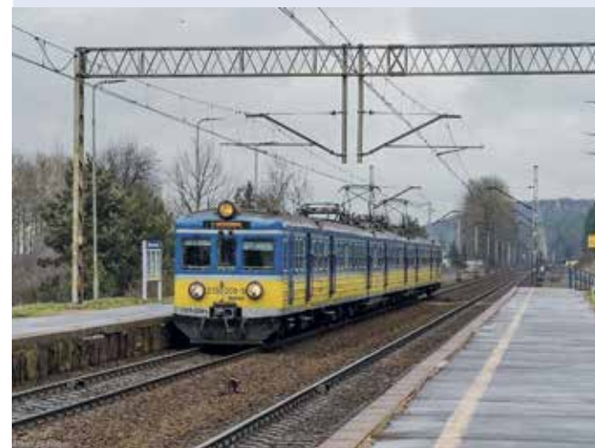
fol. SM Wejherowo

WEJHEROWO | Wejherowscy Strażnicy zostali wezwani na przystanek SKM Wejherowo-Śmiechowo do mężczyzny, który dopuścił się czynu nieobyczajnego w obecności osób czekających na przyjazd kolejki.