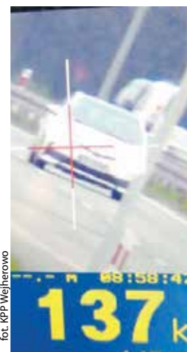
fol. KPP Wejherowo

REDA | Kierowca mitsubishi na obowiązującej 70-tce w Redzie w rejonie przejścia dla pieszych przekroczył prędkość o 76 km/h. W tym samym miejscu policjanci drogówki zatrzymali również kierowcę toyoty, który także znacznie przekroczył dozwoloną prędkość.