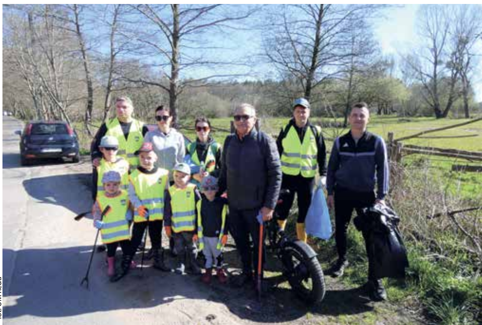
for. UM Reda

REDA | 22 kwietnia w całym kraju obchodziliśmy Międzynarodowy Dzień Ziemi. Z tej okazji pracownicy Urzędu Miasta w Redzie pod patronatem Burmistrza Miasta Redy zorganizowali społeczną akcję „Sprzątanie rzeki Redy 2023”.