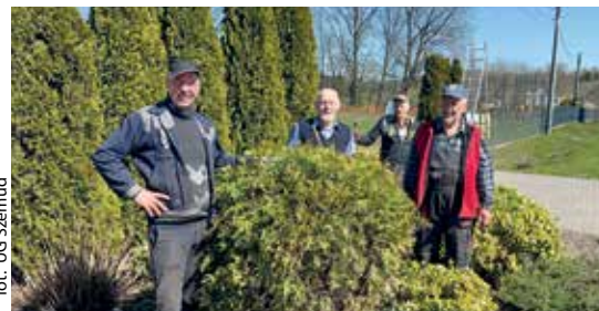
for. UG Szemud