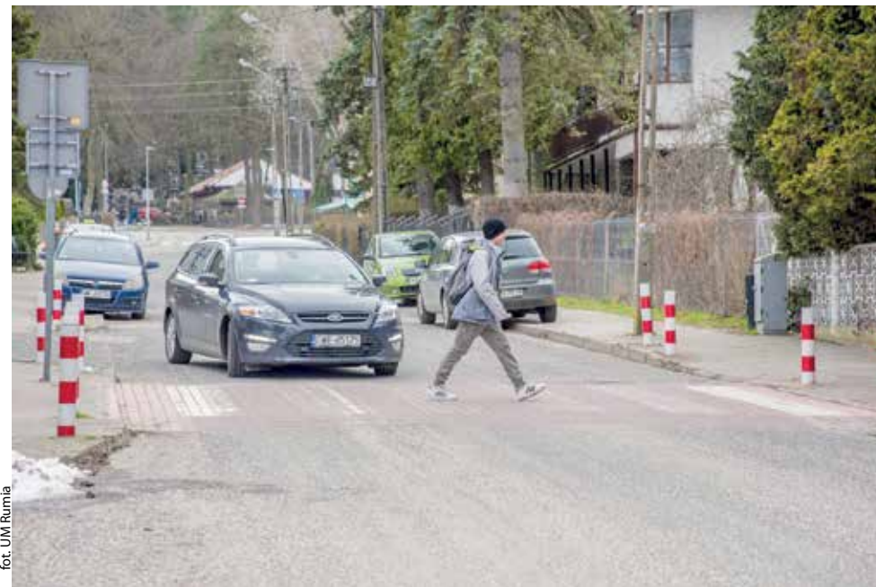
for. UM Rumia

RUMIA | Znajdujące się przy Szkole Podstawowej nr 10 w Rumii przejście dla pieszych ma być jeszcze bezpieczniejsze. Urzędnicy starają się o rządowe dofinansowanie, które umożliwi montaż podświetlanych znaków i monitoringu, a także wyniesienie tarczy skrzyżowania. Bez względu na to, czy uda się zdobyć dotację, miasto doświetli przejście dla pieszych.