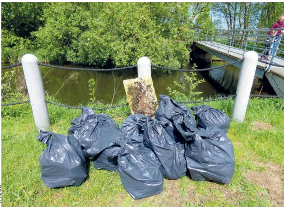
for. UM Reda