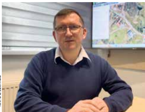
for. UG Szemud

GMINA SZEMUD | Budowa sygnalizacji świetlnych w miejscowościach na terenie gminy, ustawianie fotoradarów czy też przeprojektowanie układów drogowych, aby podnieść bezpieczeństwo i komfort podróżowania. To tylko część zapowiadanych inwestycji.