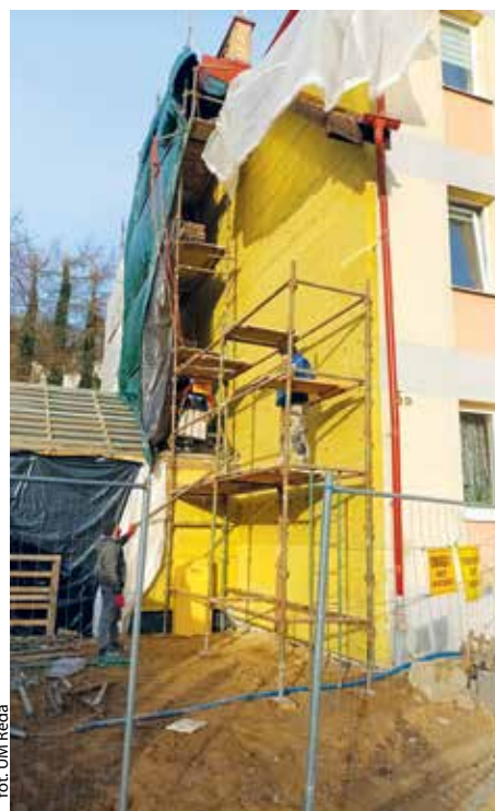
fol. UM Reda