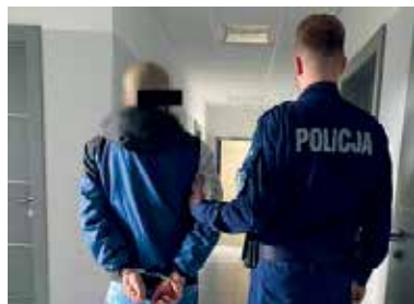
fol. KPP Wejherowo

REDA | Mężczyzna, który znęcał się fizycznie i psychicznie nad swoją żoną został zatrzymany przez policjantów z Redy. Redzianin z miejsca interwencji trafił do wejherowskiej komendy i po wykonaniu czynności osadzono go w policyjnej celi.