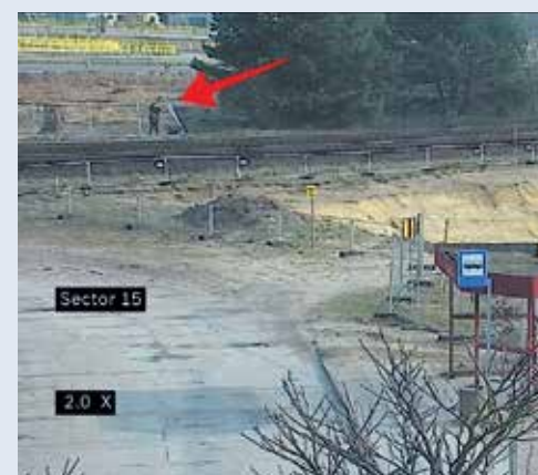
fol. SM Wejherowo

www.gwe24.pl | redakcja@expressy.pl | www.expressy.pl