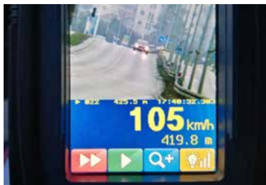
fol. KPP Wejherowo

Mundurowi szczególnie skupili się na bezpieczeństwie pieszych i kontrolowali prędkość w rejonach przejść dla pieszych. Zatrzymali prawo jazdy łącznie dziesięciu kierowcom w związku ze znacznym przekroczeniem prędkości na terenie zabudowanym. W takich przypadkach kierowcy, którzy przekraczają prędkość o ponad 50 km/h muszą się liczyć z mandatem w wysokości co najmniej 1500 zł oraz co najmniej 13 punktami karnymi. Policjanci zatrzymali także kierowcę, który w związku z popełnionym wykroczeniem przekroczył limit 24 dozwolonych punktów karnych i on także stracił prawo jazdy.