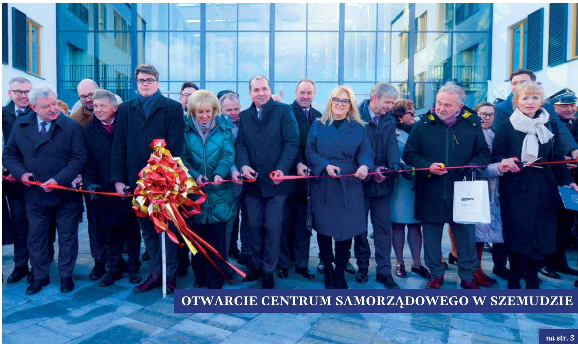
OTWARCIE CENTRUM SAMORZĄDOWEGO W SZEMUDZIE

DOWIEDZ SIĘ WIĘCEJ NA STRONIE WWW.EXPRESSBIZNESU.PL