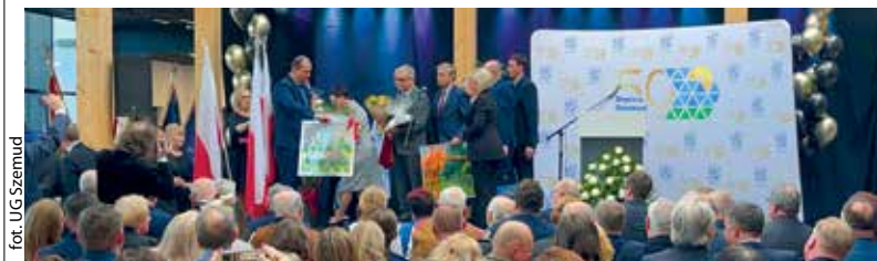
for. UG Szemud