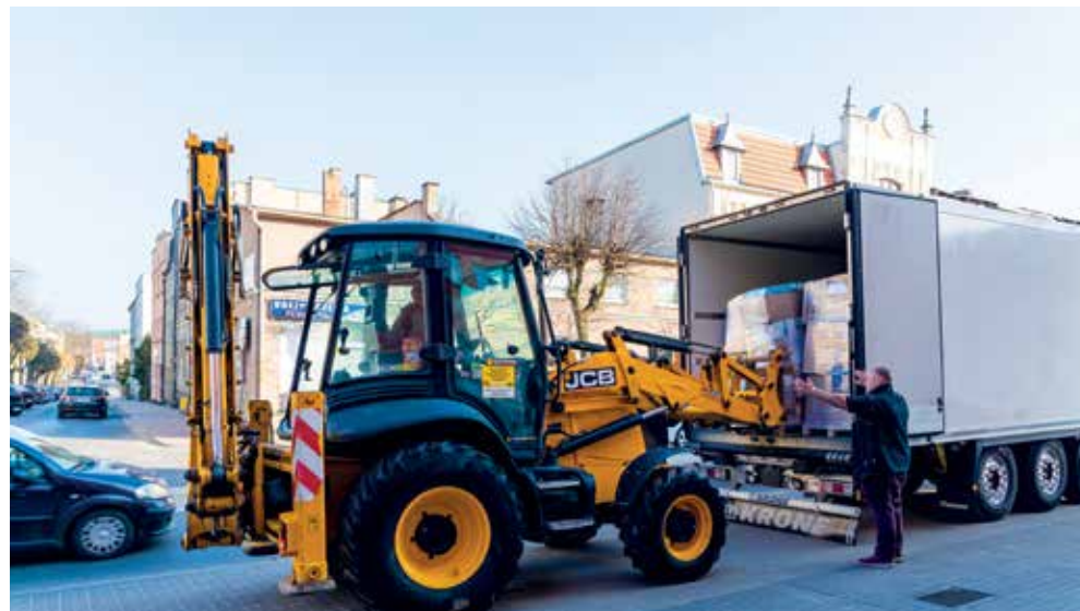
Transport z darami z Wielkiej Brytanii dla Ukraińców – 24.03.2022 r.