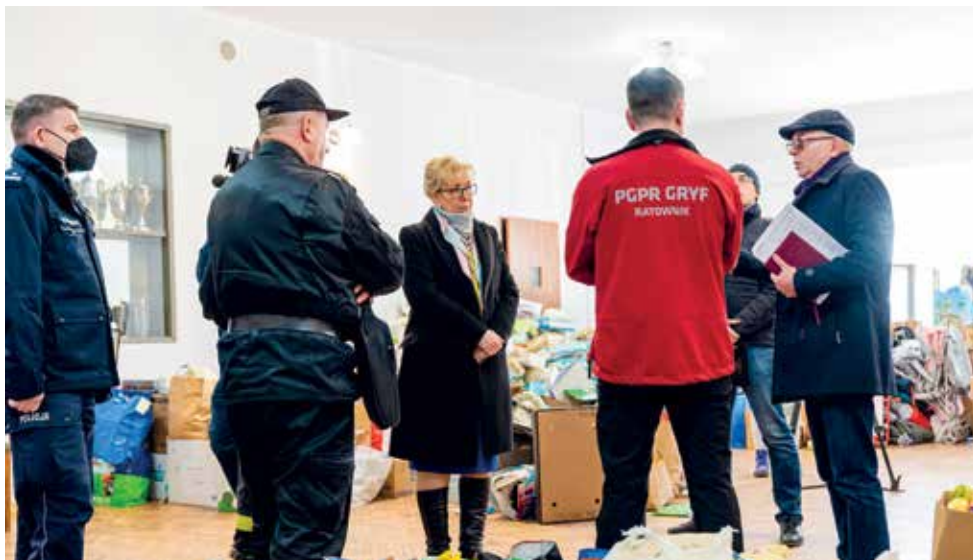
Zbiórka darów, magazyn OSP Wejherowo

Koordinacją działań na rzecz uchodźców na terenie powiatu zajmuje się Powiatowe Centrum Zarządzania Kryzysowego.