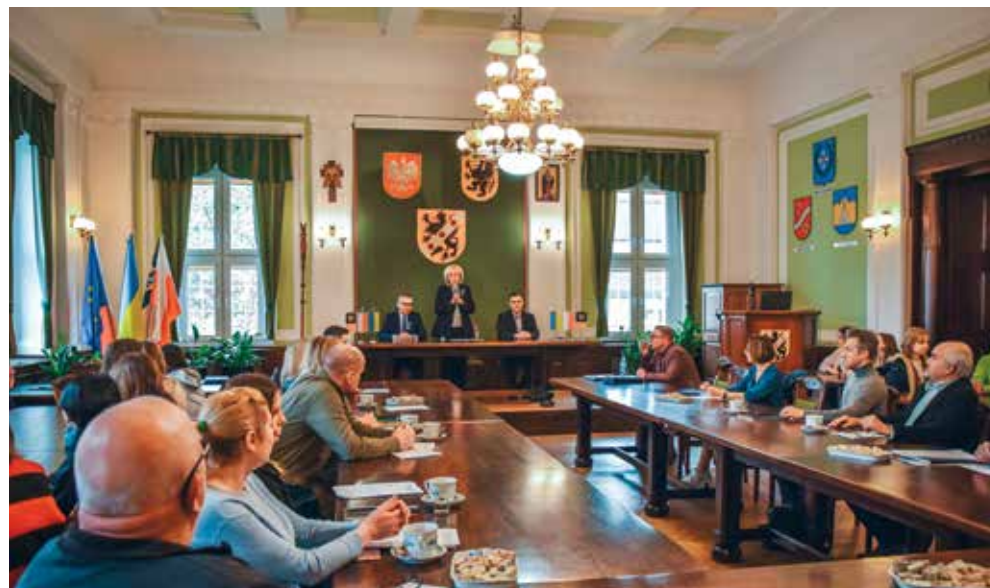
Spotkanie w Starostwie Powiatowym – 24.02.2023 r.