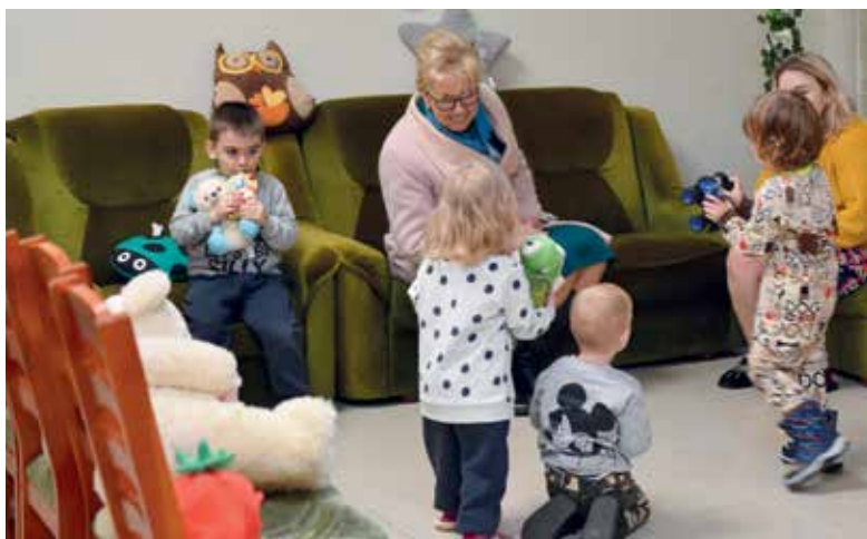
Wizytacja Starosty Wejherowskiego w Ośrodku Zbiorowego Zakwaterowania Ukraińców

Od pierwszego dnia wojny na Ukrainie mieszkańcy, uczniowie i samorządowcy aktywnie włączyli się w akcje pomocowe dla obywateli Ukrainy poprzez zbiórki darów, organizację miejsc noclegowych, wolontariat