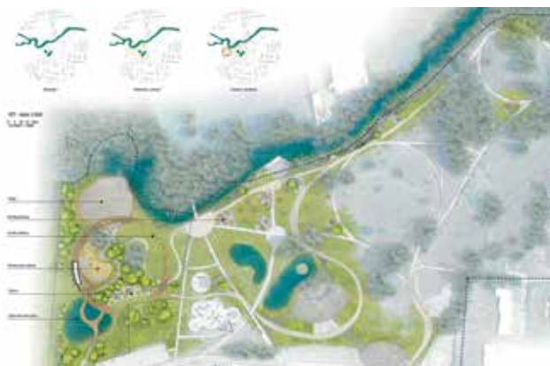
for. Jarosław Zieliński

REDA | Została podpisana umowa z autorem zwycięskiej pracy konkursowej na „Opracowanie koncepcji architektonicznej rewitalizacji i rozbudowy Miejskiego Parku Rodzinnego z tętnią oraz wodnym placem zabaw w Redzie”.