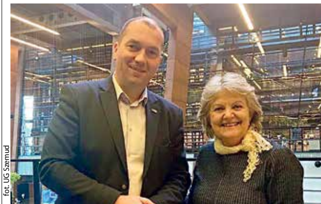
UWAGA! W tym miejscu znajduje się zdjęcie z serwisu GWE24.pl. Aby zobaczyć wszystkie zdjęcia z tej kategorii, kliknij tutaj.