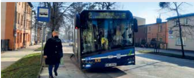
UWAGA! W tym miejscu znajduje się zdjęcie z serwisu GWE24.pl. Aby zobaczyć wszystkie zdjęcia z tej kategorii, kliknij tutaj.

POWIAT | Ze względu na przyszłe prace, możliwe będą utrudnienia w zakupie biletu.