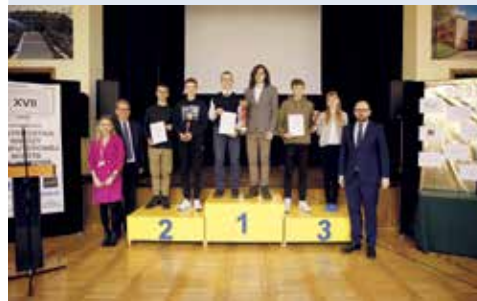
for. UM Wejherowo

WEJHEROWO | W Szkole Podstawowej nr 6 odbyły się XVII Mistrzostwa Wiedzy Komputerowej Szkół Podstawowych pod patronatem prezydenta miasta Wejherowa, Krzysztofa Hildebrandta.