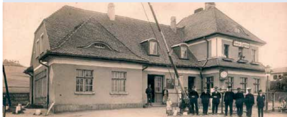
fort. UM Rumia (Nieistniejący dworzec Rumia-Zagórze - siedziba pierwszej biblioteki TCL w 1931 roku)

RUMIA | W tym roku wypadają 75 urodziny Miejskiej Biblioteki Publicznej w Rumii. Początki swojej historii instytucja ta ma w poczekalni na dworcu.