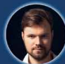
JANUSZ ŻAK bas-baryton