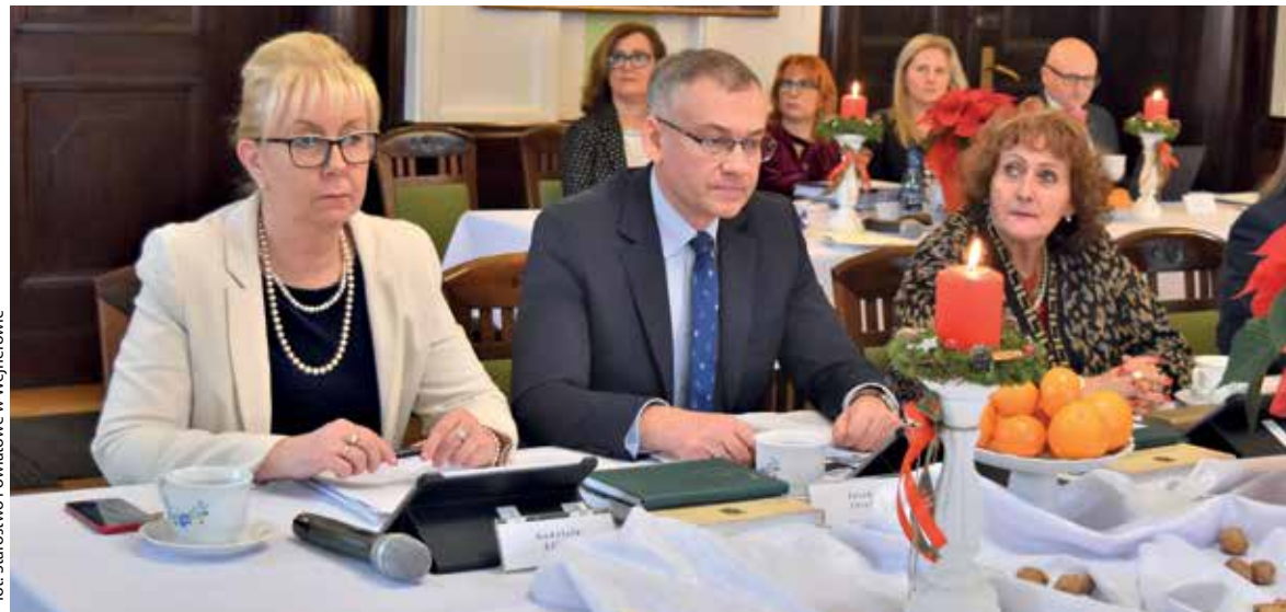
for. Starostwo Powiatowe w Wejherowie

Największa pula środków, bo blisko 148 mln zł zostanie przeznaczona na zadania z zakresu oświaty i edukacyjnej opieki wychowawczej. Wydatki w tym zakresie finansowane będą w głównej mierze z części oświatowej subwencji ogólnej, która pokrywa 84,52% wydatków na 2023 r. Oprócz bieżących zadań i remontów realizowany będzie kluczowy projekt tj. rozbudowa PZKS w Wejherowie, który otrzymał 14,3 mln z Rządowego Programu Polski Ład. Ponadto przeprowadzony zostanie drugi etap remontu Powiatowego Zespołu Szkół nr 1 w Wejherowie, w skład