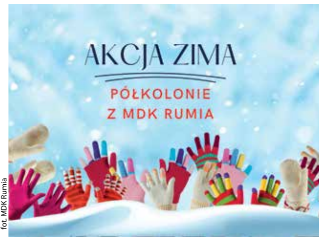
for. MDK Rumia

RUMIA | W drugiej połowie stycznia w naszym województwie rozpoczynają się ferie zimowe. Miejski Dom Kultury w Rumi tradycyjnie zaprasza młodych mieszkańców do udziału w półkoloniach.