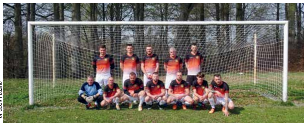
fort. GOSRiT Luzino

PIŁKA NOŻNA | Na boisku w Sychowie, rozegrany został zaległy mecz Luzińskiej Ligi Sołeckiej LZS, który decydował o tym kto zostanie mistrzem tegorocznych rozgrywek.