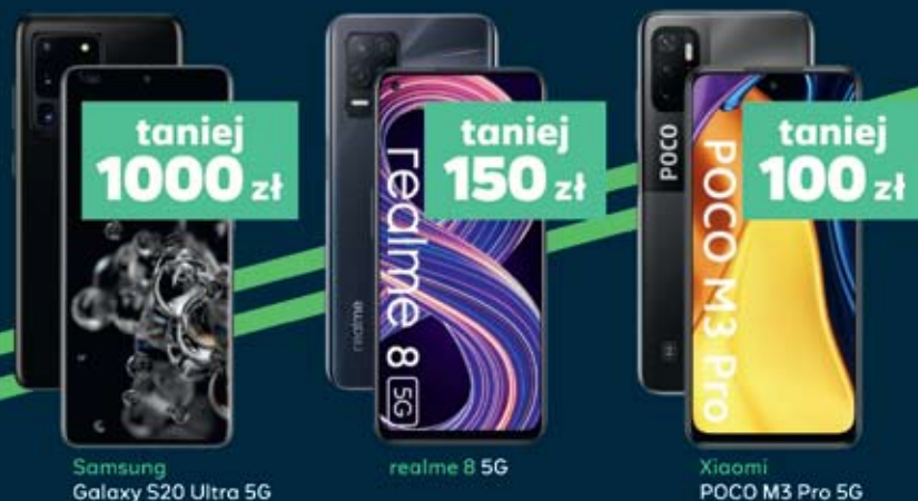
Samsung Galaxy S20 Ultra 5G