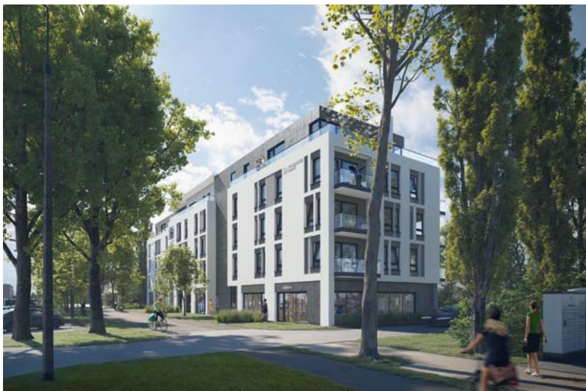
Wyjątkowo starannie została zaprojektowana elewacja budynku

www.pomorskiedomy.pl biuro@pomorskiedomy.pl