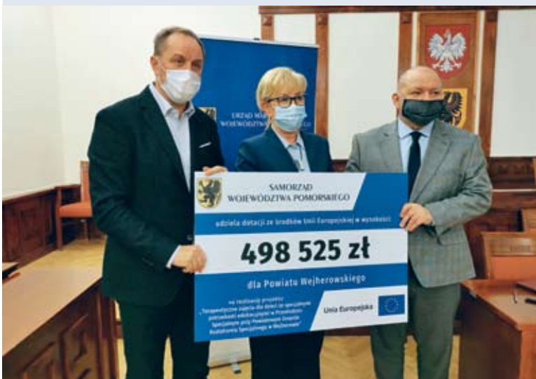
fol. Starostwo Powiatowe w Wejherowie

POWIAT | Powiat Wejherowski pozyskał dofinansowanie ze środków unijnych w ramach Regionalnego Programu Operacyjnego Województwa Pomorskiego w wysokości 498 525 zł na realizację projektu – „Terapeutyczne zajęcia dla dzieci ze specjalnymi potrzebami edukacyjnymi w Przedszkolu Specjalnym przy Powiatowym Zespole Kształcenia Specjalnego w Wejherowie”.