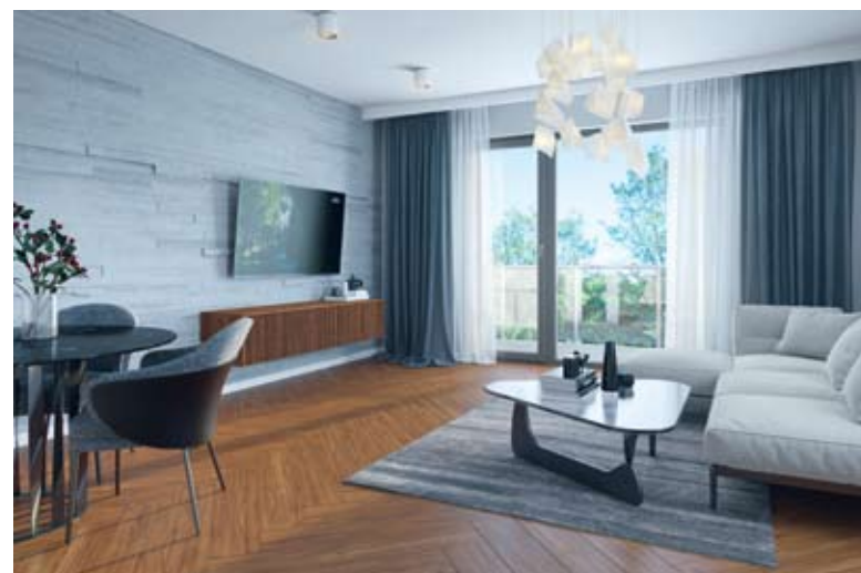
W ofercie dostępne będą wygodne i bardzo ustawne mieszkania o powierzchni od 36 m 2 do 85 m 2

Każde z mieszkań w budynku Valor wzbogacone zostanie o słoneczny balkon. Z kolei każdy z lokali na najwyższej kondygnacji będzie posiadać piękny taras widokowy. W klatkach schodowych zainstalowane zostaną cichobieżne windy. Szef sprzedaży Pomorskich Domy zapewnia, że wyjątkowo starannie przygotowane będą wszystkie