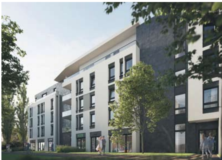
Valor powstanie w doskonałej lokalizacji - przy ulicy Dąbrowskiego, blisko granicy z Gdynią

RUMIA | Już w przyszłym roku Rumia zyska kilkadziesiąt nowych mieszkań – wszystko to za sprawą trójmiejskiego dewelopera, firmy Pomorskie Domy, który rozpoczyna właśnie budowę nowej inwestycji mieszkaniowej przy ulicy Dąbrowskiego. W 4-piętrowym budynku Valor powstną 42 wygodne mieszkania oraz 8 lokali usługowych.