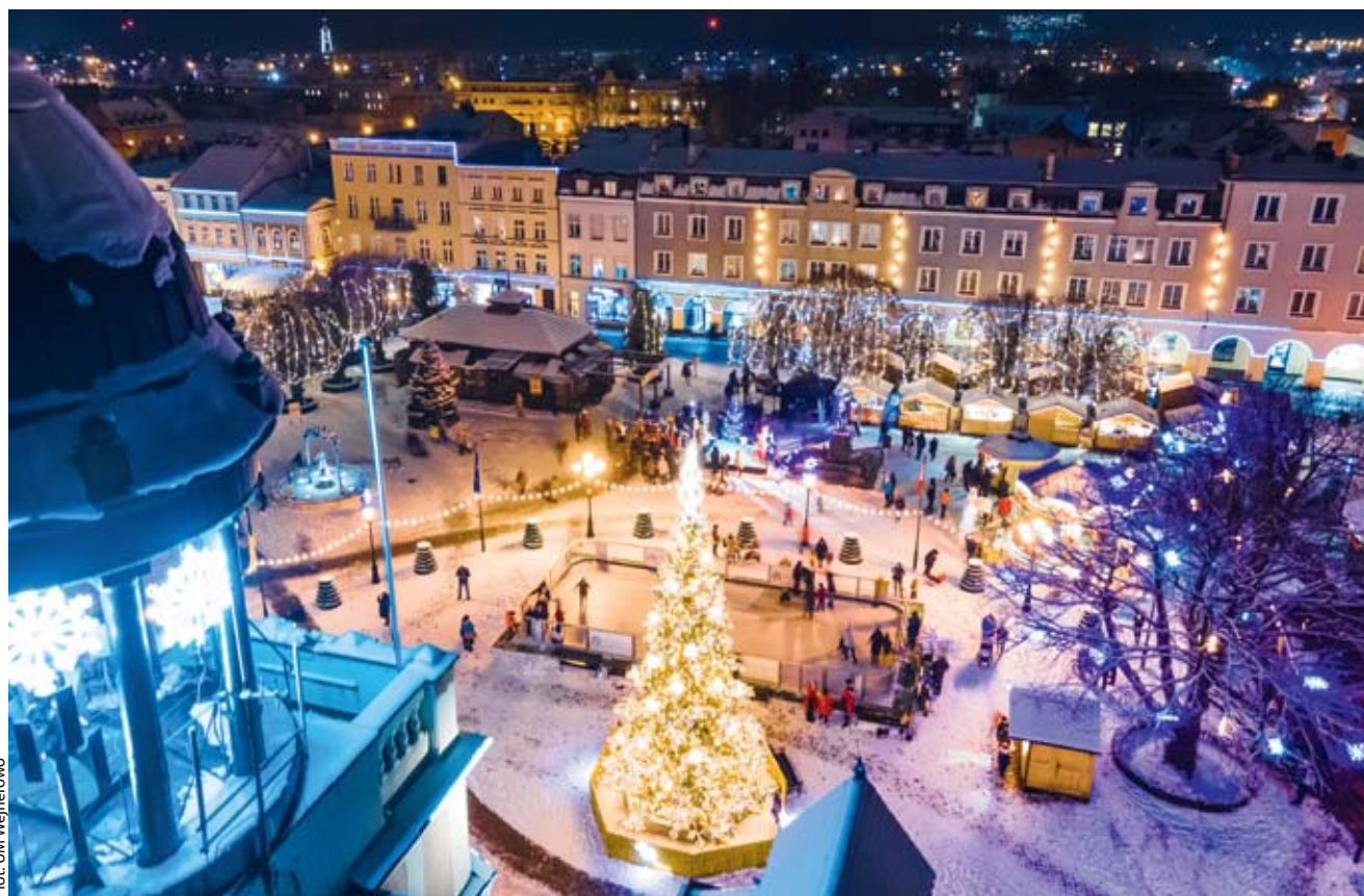
fol. UM Wejherowo

WEJHEROWO | Ruszyła XIII edycja ogólnopolskiego konkursu Świeć się z Energa. Już od 10 grudnia można głosować na miasta o najpiękniejszych świątecznych dekoracjach w regionalnym etapie konkursu. Jak każdego roku do osób potrzebujących z 16 zwycięskich miejscowości w całym kraju trafi aż 300 urządzeń AGD i lampy UV-C ufundowanych przez firmę ENERGA z Grupy ORLEN. Na laureata 1. miejsca czeka też nowoczesna instalacja fotowoltaiczna do zamontowania na placówce jak np. dom dziecka. Zachęcamy do głosowania na Wejherowo.