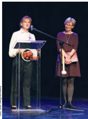
for. UM Wejherowo

- Ze względu na pandemię i fakt, że niektóre grupy teatralne przerwały z tego powodu swoją działalność, musieliśmy w zrezygnować z pomysłu na ten rok, jeśli chodzi o prezentację twórczości Wisławy Szymborskiej i Olgi Tokarczuk. Dlatego postanowiliśmy, żeby ten jubileuszowy