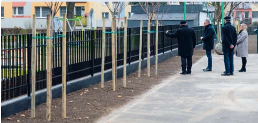
fol. Starostwo Powiatowe w Wejherowie

WEJHEROWO | Dalsza część placu wokół Powiatowej Biblioteki Publicznej oraz Powiatowego Zespołu Szkół Policealnych w Wejherowie została zagospodarowana. Teren zyskał nowy wygląd. Wykonano m.in. nowe ogrodzenie oraz posadzono drzewa.