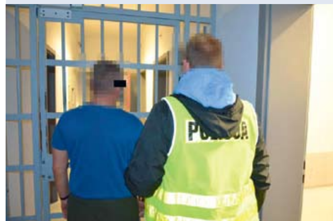
fol. KPP Wejherowo

RUMIA | Kryminalni zatrzymali 46-letniego mężczyznę, który posiadał znaczną ilość narkotyków. W garażu zatrzymanego policjanci znaleźli substancje zabronione. Mężczyzna usłyszał zarzut posiadania znacznej ilości narkotyków oraz udzielania narkotyków.