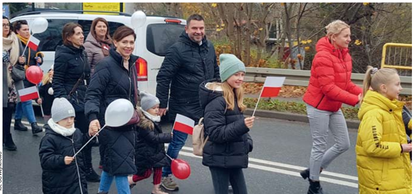
fol. UG Wejherowo

GMINA WEJHEROWO | Mieszkańcy gminy Wejherowo zebrali się 11 listopada, aby wspólnie świętować Dzień dla Niepodległej.