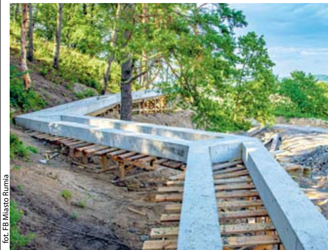
for. FB Miasto Rumia

RUMIA | Prace na terenie rekreacyjnym, który powstaje w jednej z rumskich dzielnic Zagórze nabierają tempa.