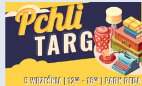
fol. UM Reda

Swoje udział zapowiadają też miejscy urzędnicy i radni Rady Miejskiej w Redzie. - Urząd Miasta, tak jak poprzednim razem ustawi namiot, w którym radni będą od-