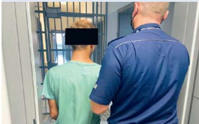
fol. KPP Wejherowo

WEJHEROWO | 22-latek z powiatu wejherowskiego dokonał rozboju na 15-latk, grożąc mu niebezpiecznym przedmiotem.