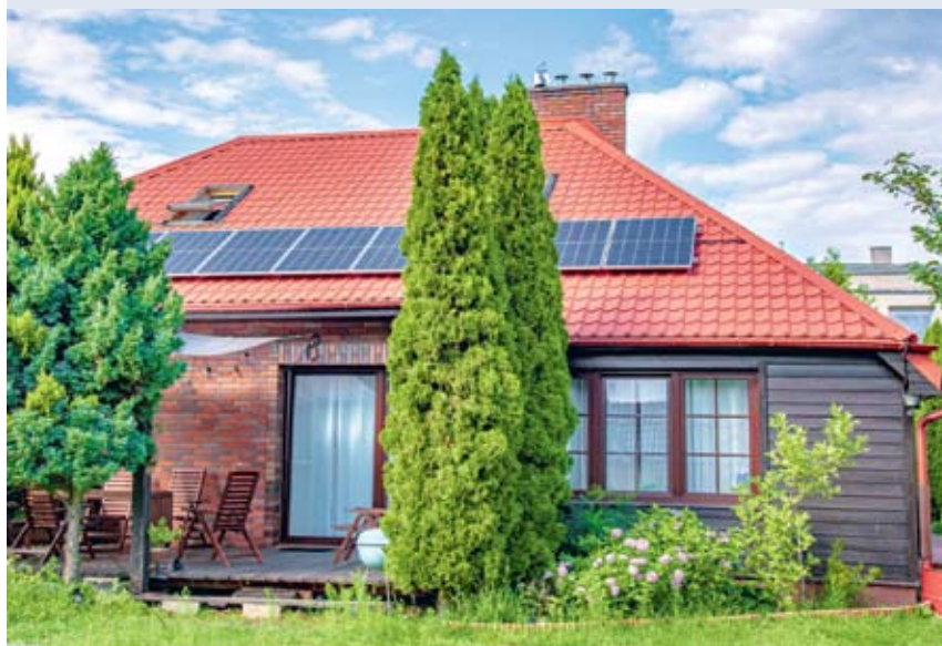
fol. UM Rumia

RUMIA | Ponad 200 instalacji fotowoltaicznych, wraz z systemami zarządzania energią, pojawia się na budynkach mieszkalnych oraz obiektach użyteczności publicznej zlokalizowanych na terenie Rumi i Szemudu. To efekt wspólnych projektów, na które pozyskano ponad 5,5 mln zł unijnej dotacji.