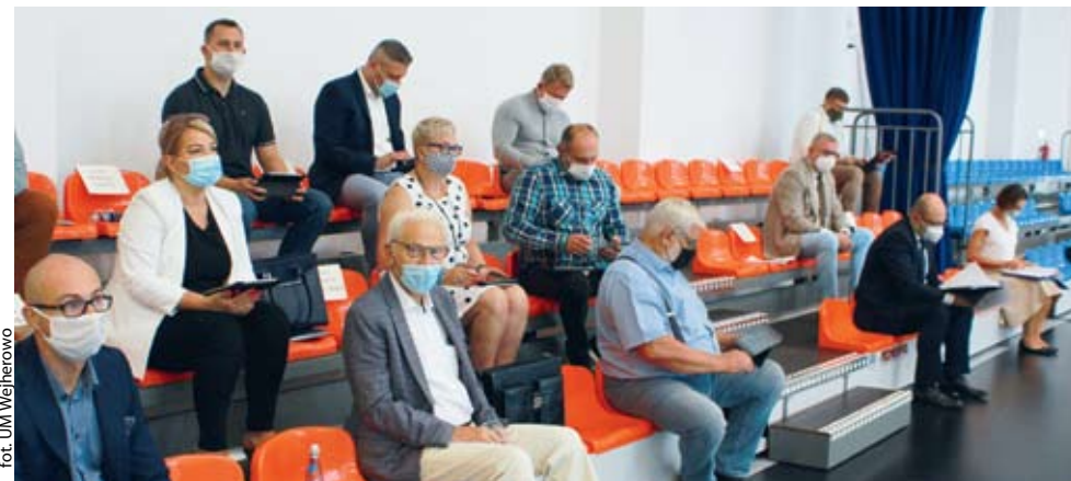
fol. UM Wejherowo

WEJHEROWO | Podczas dzisiejszej (16.08) sesji radni przyjęli uchwały przede wszystkim konieczne do zapewnienia normalnego funkcjonowania miasta. Radni m.in. dokonali zmian w budżecie, przyznali dotację na pomoc dla wspólnoty mieszkaniowej na remont zabytkowej kamienicy oraz nadali nazwę ulicy wewnętrznej.