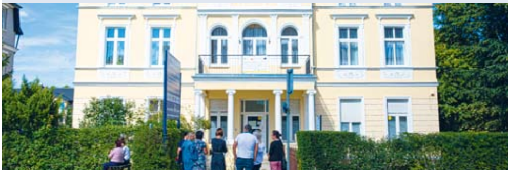
fol. UM Wejherowo

WEJHEROWO | Kolejne zabytkowe budynki należące do wspólnot mieszkaniowych zostały odnowione w ramach realizowanego przez Urząd Miejski projektu „Rewitalizacja Śródmieścia Wejherowa” i otrzymano na ten cel środki z Unii Europejskiej. Remonty przeprowadzone zostały w dwóch kamienicach - przy ul. Puckiej 9 i Dworcowej 1.