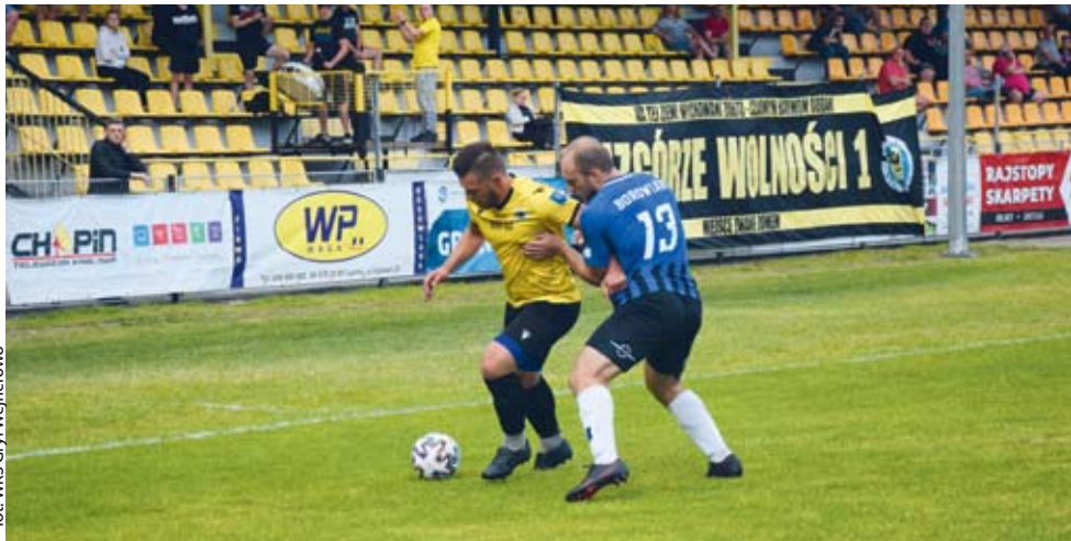
for: WKS Gryf Wejherowo

PIŁKA NOŻNA | Wprawdzie piłkarze Gryfa Wejherowo po pierwszych 45 minutach przegrywali 0:1, to w drugiej odsłonie żółto-czarni pokazali charakter i wygrali.