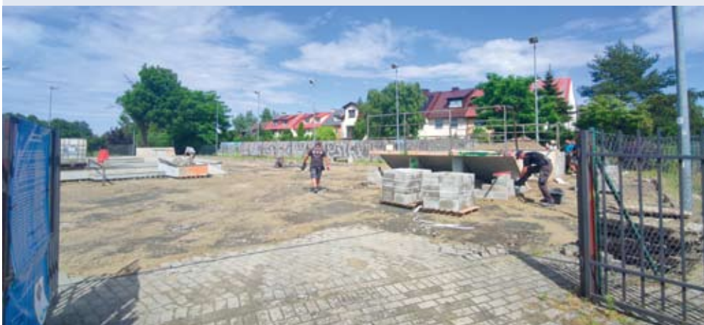
fol. UM Reda

REDA | Od 28 czerwca redzki skatepark jest nieczynny. Rozpoczęła się planowana, kompleksowa modernizacja, która potrwa do połowy sierpnia.