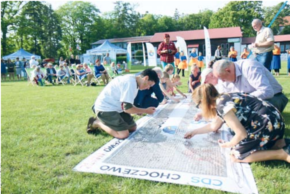
fol. Mat. pras.

GM. CHOCZEWO | Około 200 mieszkańców gminy Choczewo zaangażowała się we wspólne działanie. Włączyli się do ogólnopolskiej akcji charytatywnej Kilometry Dobra, aby zebrać pieniądze i zaktywizować innych.