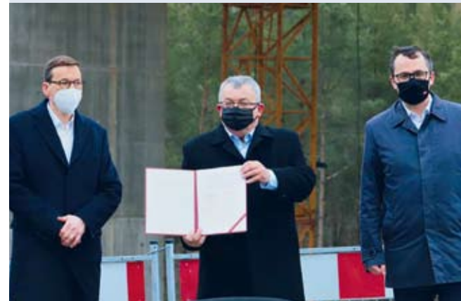
fol. Mat. pras.

POMORZE | Umowy na zaprojektowanie i budowę dwóch odcinków Obwodnicy Metropolii Trójmiejskiej (OMT) w ciągu drogi ekspresowej S6 zostały podpisane.