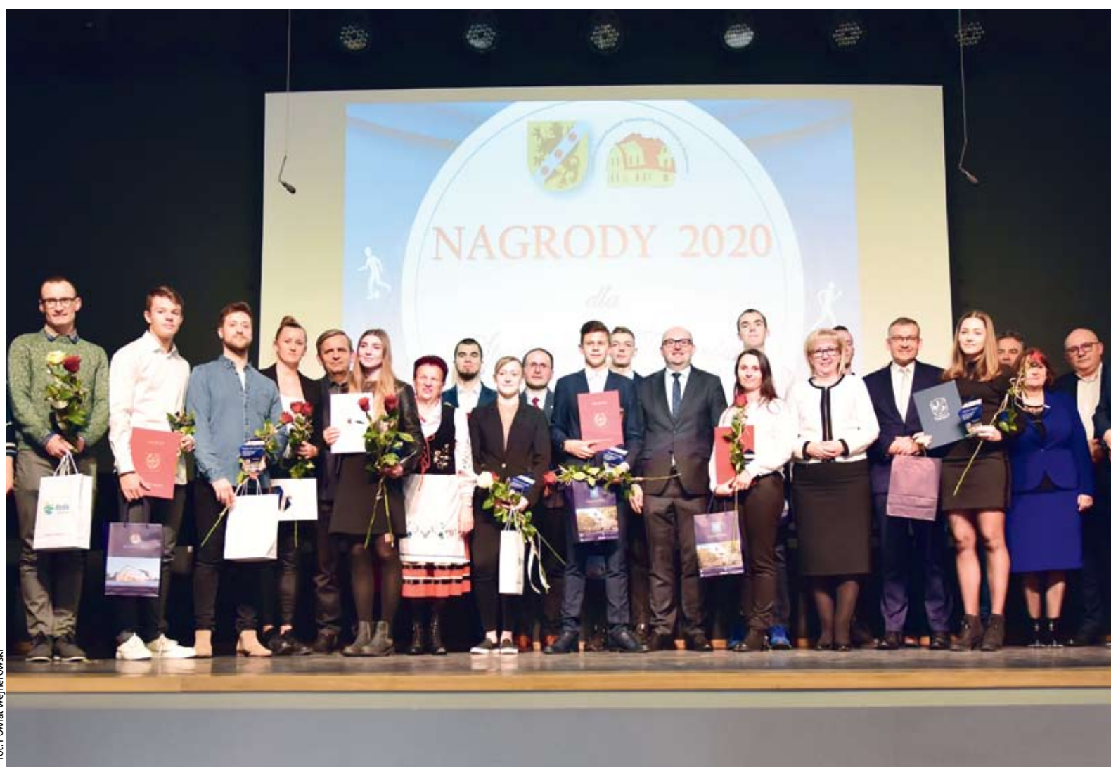
ZDJĘCIE Z UBIEGŁOROCZNEJ GALI SPORTU, PODCZAS KTÓREJ NAGRODZENI ZOSTALI NAJLEPSI SPORTOWCY I TRENERZY.

W tym roku ze względu na epidemię, samorząd zrezygnował z organizacji uroczystej gali. W najbliższych dniach nagrody trafią bezpośrednio na konta wyróżnionych osób, zaś pamiątkowe dyplomy zostaną przesłane listownie.